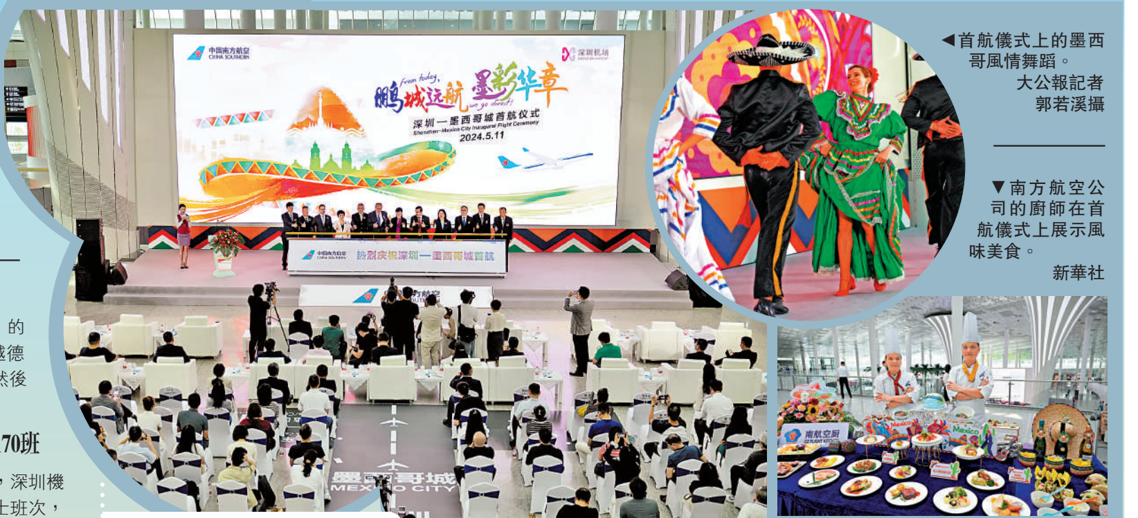
◀首航儀式上的墨西哥風情舞蹈。

深圳機場相關負責人表示，下一步，深圳機場還將陸續開通深圳至沙特利雅得、奧地利維也納等城市的國際航線，並持續增加至日韓、東盟等國家的航線航班班次，加快連通世界級灣區、全球大型都市圈及高新技術產業城市。