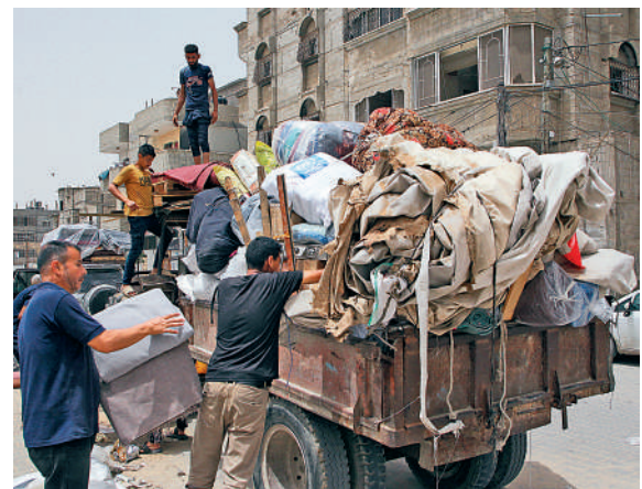
▲拉法民眾11日收拾家當，準備撤離。

近東救濟工程處通訊經理沃特利奇表示，在以軍發出最新的撤離命令後，「今天早上在拉法西部地區，你所看到的每一個家庭都在收拾行李。街道上空無一人。」拉法居民薩塔里表示，以軍給他打了3通電話，鄰居們也催促他快點撤離。「我們應該怎麼辦呢？我們要在這裏等死嗎？所以我們決定離開，這樣更好。」另一位居民拉菲表示：「我們因為恐懼被迫離開，正前往未知的地方。加沙根本沒有安全的地方，剩下的所有區域都不安全。」有被迫四處躲藏、流離失所的巴勒斯坦民眾哭喊：