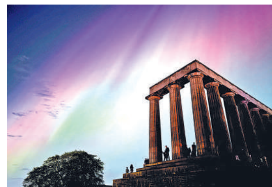
▲愛丁堡蘇格蘭國家紀念碑上空10日出現極光。

中國國家太空氣象監測預警中心11日發布地磁風暴紅色預警，預料國內大部分地區電離層將出現擾動，短波通訊和導航定位會受到不同程度的影響。