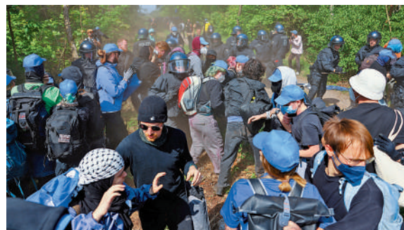
▲試圖闖入柏林附近特斯拉工廠的示威者10日與警方爆發衝突。

今年2月，格倫海德近三分之二的居民投票反對特斯拉擴建工廠的申請。此後，有示威者開始在附近紮營，抗議該擴建項目。3月，一個自稱「火山」的組織對該座特斯拉工廠附近的高壓電塔縱火，工廠供電被切斷，廠房隨後關閉一星期。