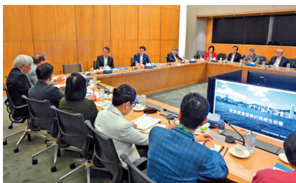
行政長官李家超昨日帶領一眾主要官員與行政會議非官守成員舉行集思會，就「香港經濟發展的策略性部署」作出深度交流和討論。

題，希望與行政會議非官守成員更深入和更集中地探討具前瞻性、策略性的政策，為香港拚經濟、拚發展。 李家超續表示，香港是世界唯一同時集中中國機遇及國際機遇於一身的城市，在國內和國際雙循環中，要利用好「超級聯繫人」和「超級增值人」角色，讓香港獲得最佳的經濟發展和商機，政府會與社會各界共同推動香港經濟發展、改善民生。