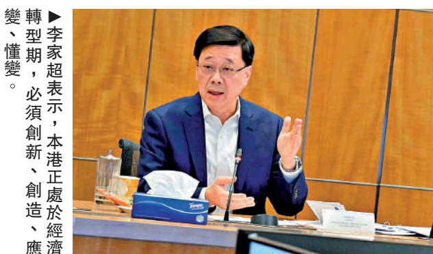
李家超表示，本港正處於經濟轉型期，必須創新、創造、應變、懂變。

【大公報訊】記者龔學鳴報導：行政長官李家超昨日帶領一眾主要官員與行政會議非官守成員舉行集思會，就「香港經濟發展的策略性部署」作出深度交流和討論，集思廣益。隨後，李家超在社交平台指出，香港現在社會普遍安全穩定，是發展經濟的最佳時期。 李家超表示，本港正處於經濟轉型期，必須創新、創造、應變、懂變，所以特別舉行這次集思會，並以經濟發展為