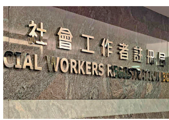
本港不同團體支持當局盡早改革及完善社會工作者註冊局。

勞工及福利局局長孫玉菡在文章亦提及，註冊局在2023年底起停止實施「註冊社會工作者自願持續專業發展計劃」（「社工持續專業發展計劃」），致使社工持續專業發展的工作停滯不前，影響市民福祉。