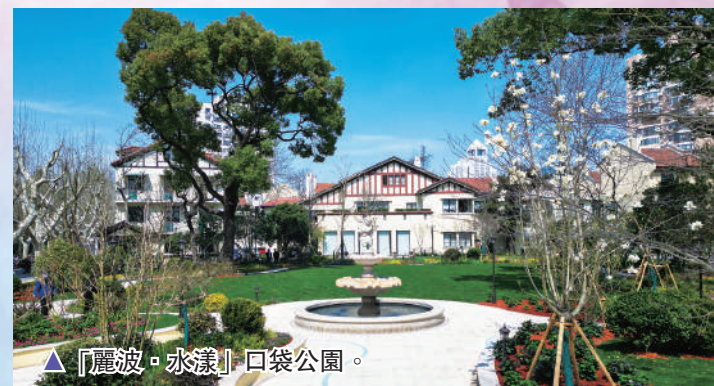
▲「麗波·水漾」口袋公園。

華漕門戶功能區 ，聚焦「新產業」「新經濟」「新交通」「新生態」「新治理」「新家居」「新生活」，全力打造「五宜新華漕」。聚焦人工智能、生物醫藥、高端製造等領域，加強與漕開發、徐匯濱江產業聯動。對標城市副中心標準，打造科創重鎮和生態新城。