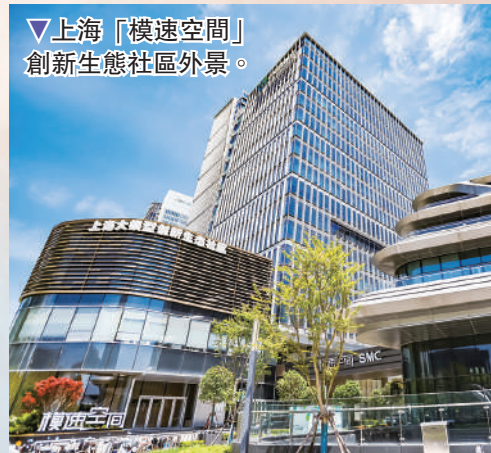
▽上海「模速空間」創新生態社區外景。