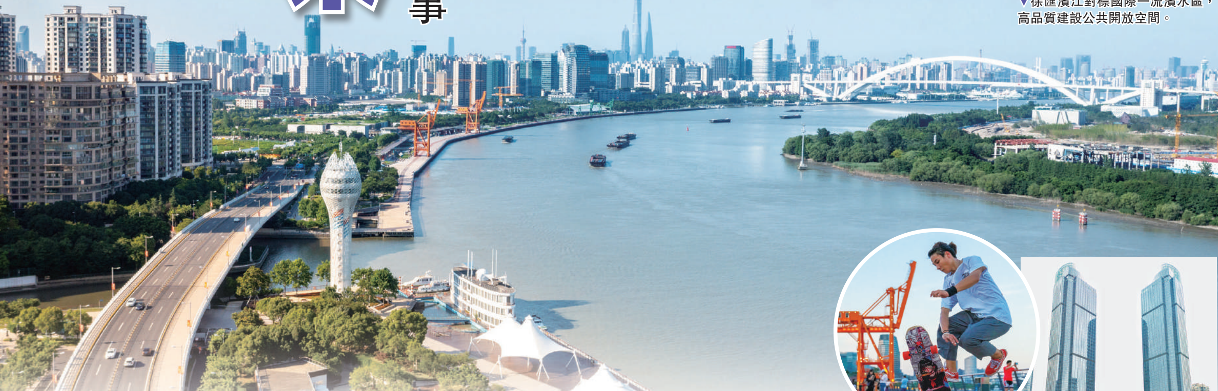
▽徐匯濱江對標國際一流濱水區，高品質建設公共開放空間。