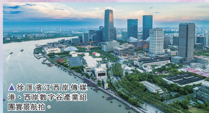
▲徐匯濱江西岸傳媒港、西岸數字谷產業組團實景航拍。

當前，徐匯已開啟新時代發展新篇章，鍛長板、揚優勢、優布局、強功能，打造高質量發展的強勁增長極。優化產業生態和創新生態，推動數字經濟、生命健康、文化創意、科創金融四大戰略產業加速邁向千億級。聚焦全球資源配置，搶抓元宇宙、綠色低碳、智能終端新賽道，提高新賽道產業的集聚度和貢獻度。前瞻布局大模型、具身智能、合成生物先導產業，打通轉化-孵化-產業化的創