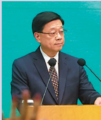
▲▲政府改組社工註冊局，行政長官李家超（小圖）表示，絕對支持任何對現時系統撥亂反正的措施。