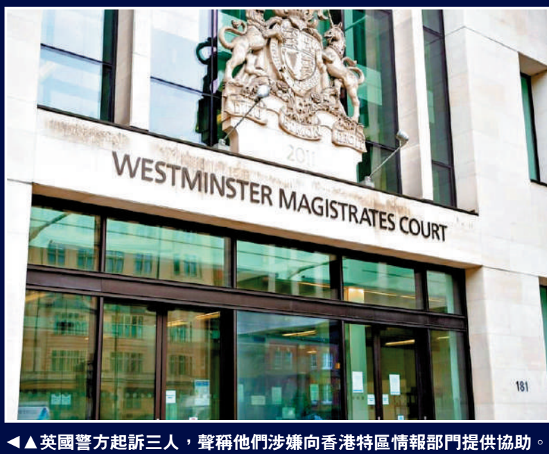
英國警方起訴三人，聲稱他們涉嫌向香港特區情報部門提供協助。