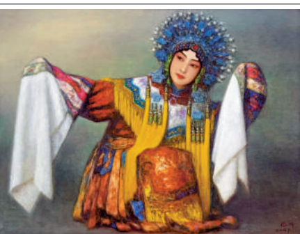
▲美術家張橋創作的油畫《貴妃醉酒》。