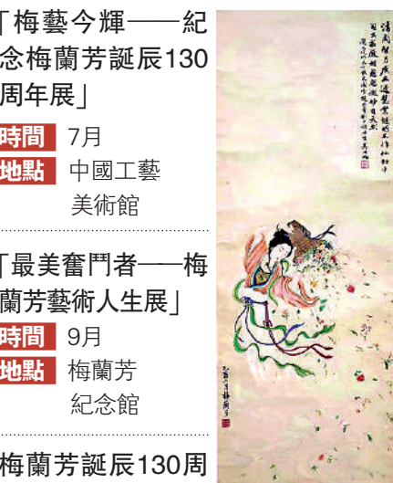
▲梅蘭芳創作的《天女散花圖》。