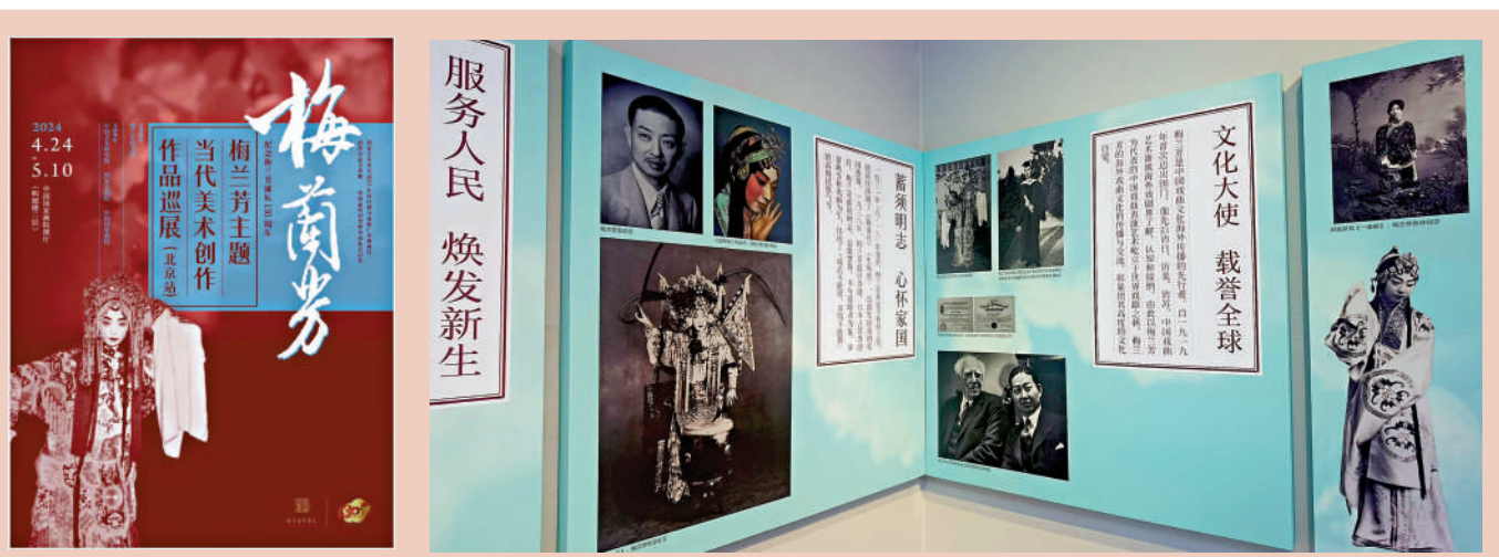
▲「梅蘭芳主題當代美術創作作品巡展」在中國國家畫院啟幕。

此次展覽的一個重要板塊就是當代藝術家對梅蘭芳生活形象與舞台形象的重現。在璀璨的藝術生涯裏，梅蘭芳塑造了數百位女性形象，無論是傳統戲中的楊玉環、王寶劍、趙艷容，還是時裝新戲裏的孟素卿、鄧霞姑，在梅蘭芳的