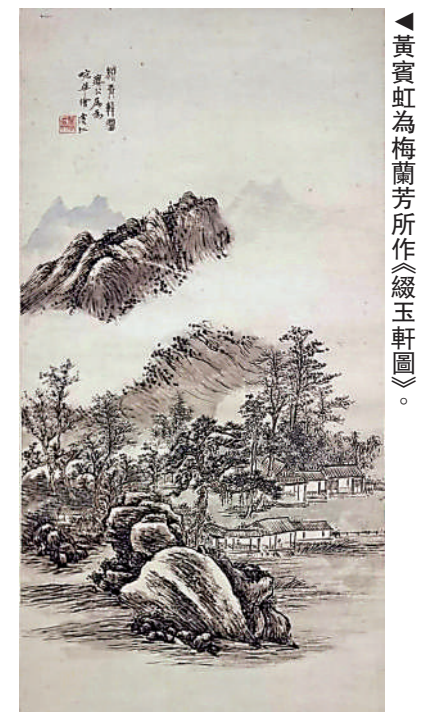
▲黃賓虹為梅蘭芳所作《緞玉軒圖》。

據悉，「梅蘭芳主題當代美術創作作品巡展」將在北京、重慶、雲南昆明、江蘇泰州、湖北武漢與梅蘭芳紀念館等「五地一館」打造展覽之旅，以實際行動回應梅蘭芳先生晚年希望「送戲走遍祖國基層」的心願和遺志。