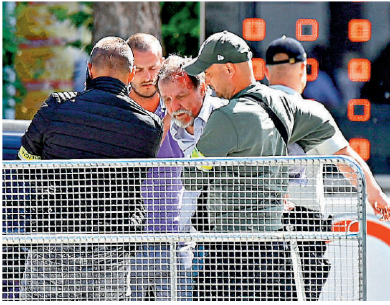
▲斯洛伐克總理菲佐15日遭槍擊，警方在案發現場逮捕一名嫌犯。

【大公報訊】據美聯社報道：斯洛伐克總理菲佐15日在該國特倫欽地區遭槍擊，腹部受傷，被緊急送醫。斯洛伐克政府稱，菲佐身中數槍，有生命危險。警方已逮捕一名男性嫌疑人。多位歐洲國家領導人譴責此次事件，並希望菲佐早日康復。