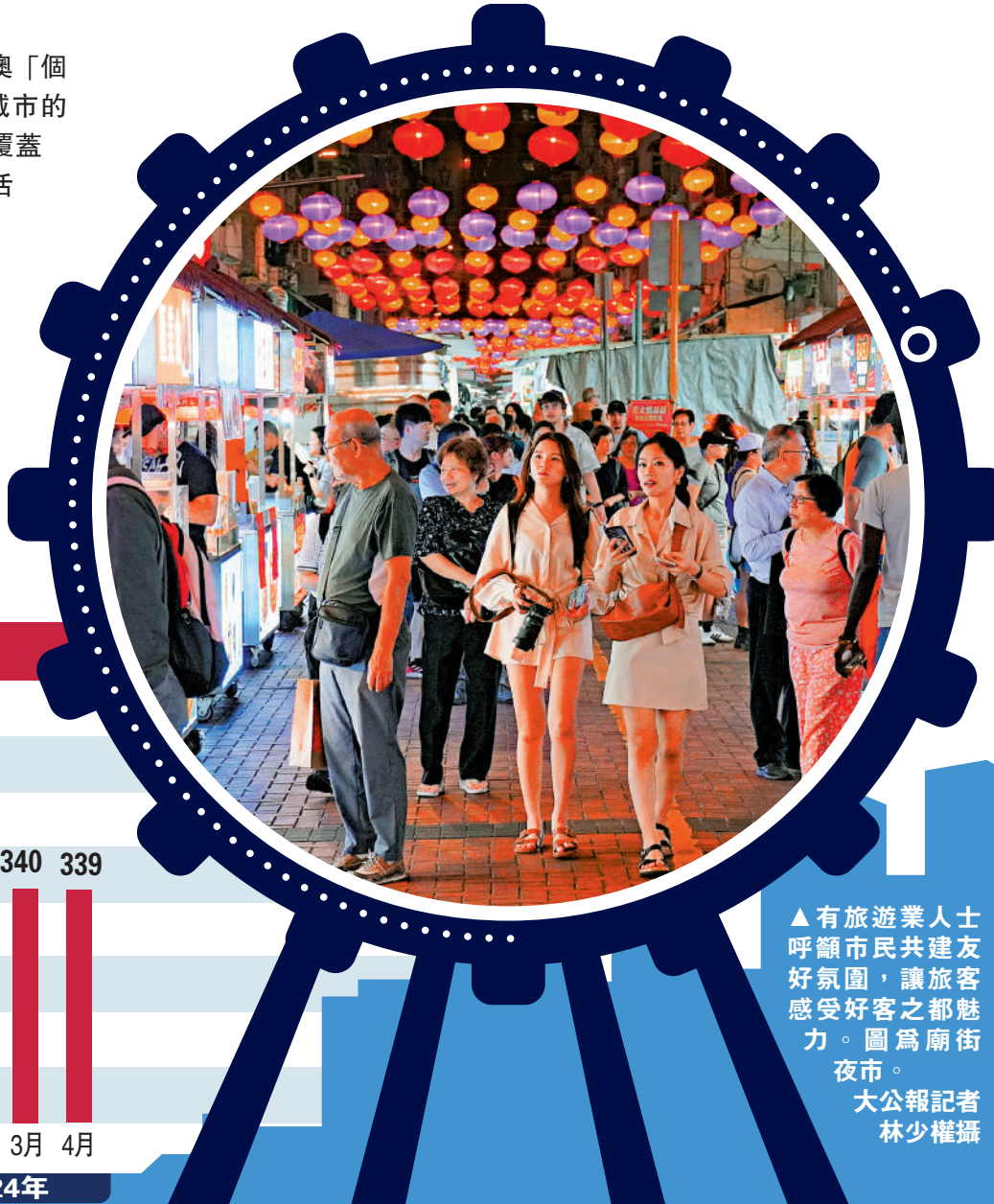
▲有旅遊業人士呼籲市民共建友好氛圍，讓旅客感受好客之都魅力。圖為廟街夜市。