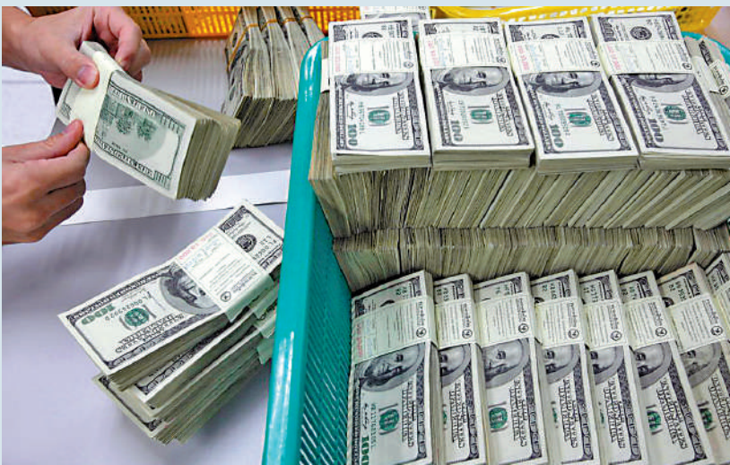
▲美國財政和貨幣政策缺乏約束，加之美國債務不斷攀升，各國持有的美債規模或逐步下降。

今年以來，國際金價持續上攻，各國央行增持黃金儲備。世界黃金協會的數據稱，今年一季度全球黃金需求總量同比增長3%至1238噸，需求量为2016年以來同期最勁。中國人民銀行的數據顯示，截至4月末，中國黃金儲備規模環比增長6萬至7280萬盎司，已連續18個月加倉黃金。 瑞銀財富管理投資總監辦公室認為，當前市況下，黃金仍是對沖地緣政治風險的較好工具，可提高投資組合的多元化、降低長期波動性，預計到今年末，國際金價有望觸及每盎司2500美元。