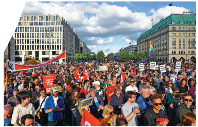
▲民眾本月在柏林示威，譴責針對政客的襲擊行為。

隨著歐洲議會選舉和地方選舉的臨近，今年針對德國政客的言語和肢體攻擊事件數量激增。有媒體直言，出於俄烏衝突、氣候危機、經濟不確定性等原因，越來越多人不願再進行政治對話，而是訴諸暴力。針對有輿論將政治暴力事件增多歸咎於德國選擇黨的崛起，該黨聯合主席魏德爾表示，企圖利用襲擊事件來獲取政治利益是「卑鄙且不負責任的」，德國選擇黨的政治人物和成員也時常受到襲擊。