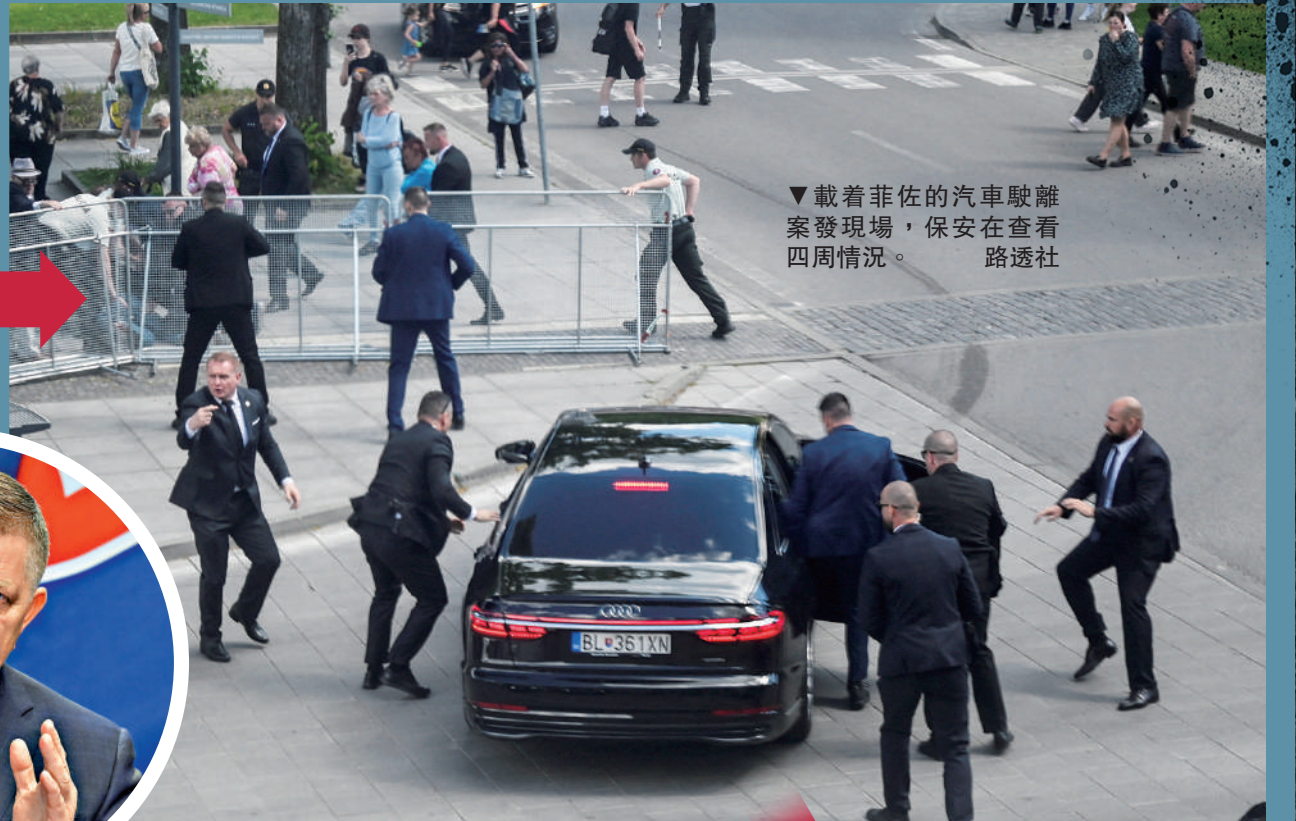
▼載着菲佐的汽車駛離案發現場，保安在查看四周情況。

斯洛伐克總理菲佐15日在斯洛伐克特倫欽地區遇刺，身中5槍，被緊急送院。他接受了5個多小時的手術，目前狀況穩定，但傷勢嚴重。斯洛伐克政府稱，初步信息顯示，刺殺行動「出於政治動機」，嫌犯對政府及其改革措施不滿。此次槍擊是歐洲國家領導人20多年來首次遭遇重大刺殺未遂事件，多國發聲譴責。分析認為，受俄烏衝突、生活成本危機等因素影響，整個歐洲政治極化嚴重，社會撕裂加劇，暴力活動蔓延，針對政客的襲擊事件亦不斷增多。