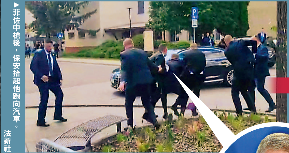
菲佐中槍後，保安抬起他跑向汽車。