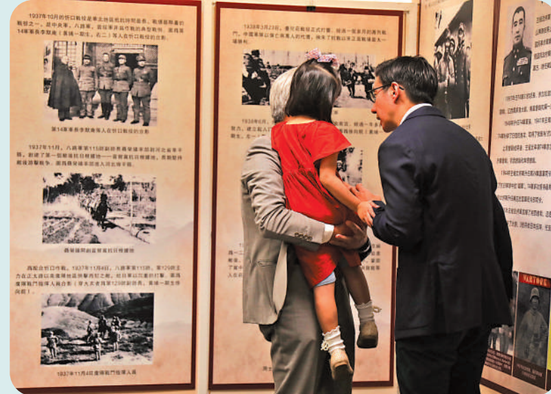
▲「百年黃埔 薪火相傳——紀念黃埔軍校建校一百周年圖片聯展」一隅。

圖片聯展在港大徐展堂樓五樓舉辦，簡單的主席台一側掛有黃埔軍校校訓「親愛精誠」四字行書。黃埔軍校由孫中山先生於一九一四年在蘇聯幫助下在廣州創立，正式名稱是陸軍軍官學校，今年是建校一百周年。選擇在港大舉辦展覽，因為孫中山是港大校友，他的革命思想形成，與港大有重要關係。活動現場共展出四十三組圖片，包括一張孫文用大元帥府信箋手寫任命蔣中正為校長的委任狀。圖片展內容主要介紹黃埔創校初期的東征和北伐，以及抗戰期間黃埔出身的國共兩黨將領共赴國難、抗敵衛國的重要事件。除了歷史照片，還有統計數字，例如「黃埔軍校第一至第五期畢業生統計表」顯示，有來自全國二十多個省，以及朝鮮、新加坡和越南等地總共七千三百九十九名畢業生，包括有兩名來自當時日本佔領下的台灣，最多畢業生是來自湖南共二千一百八十九人，比廣東學生一千零三十六人多逾倍。湘軍驍勇善戰，不是浪得虛名。另一項統計顯示黃埔軍人在抗戰中發揮重要作用：中國遠征軍軍銜以上高級將領中，有三十二名是黃埔出身。際平兄補充另一項數字：中共建國後的十大元帥，有一半是出自黃埔，分別是林彪、陳毅、徐向前、聶榮臻、葉劍英，大將陳賡也是黃埔出身。沒有評軍銜的軍事家周恩來曾任黃埔軍校政治部主任，毛澤東