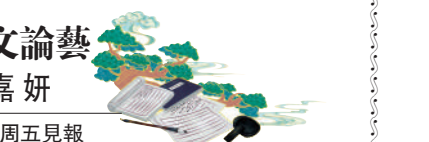
談文論藝嘉妍 逢周五見報

史密羅夫在澳門逗留期間會教人繪畫，通過這些學生介紹，有機會參與伯多祿五世劇院(即崗頂劇院)的布景設計工作。不用工作的時候便四處寫生，每次都吸引大批群眾圍觀。