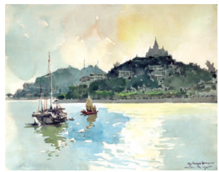
山》(附圖)是其一，由喬治·史密羅夫創作。在相機還未普及的年代，人們會

練習合唱的過程中，除了音樂方面的知識和技巧，我也會思考可從中領悟的哲理，不滿足於機械式的操