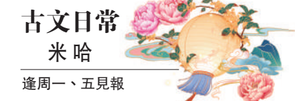
古文日常米哈 逢周一、五見報

或許有人不認同沙特的說法，也未必有如李賀一般的凌雲壯志。然而，負面的想法，有時也可以達到成功的自我鼓勵：既然我不是什麼偉人，那我還需要擔憂什麼呢？古希臘犬儒主義者第歐根尼如是說。