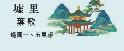
墟里葉歌 逢周一、五見報

他人有權做自己的判斷，過自己的人生，即便我們不認可他們的選擇，不會走上同樣的道路。倒是接連兩起因悼亡帖引發的爭議中，有些網友「簡單粗暴」、過分「厭弱」，折射出的恐怕不是道德感充沛，而是自我安全感缺失、同理心缺口。