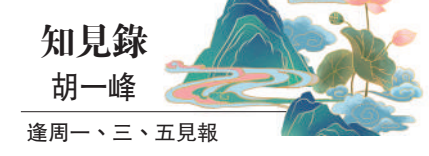
知見錄胡一峰 逢周一、三、五見報

「淡」。所謂「從來不需要想起，永遠也不會忘記」，而網友常說的「晒恩愛，死得快」似乎從反面說明了同一個道理。「淡」是暫停卻不是終止，是波瀾不驚卻不該死水一潭。真水無香，真「淡」最難，人間喧囂，眾生嘈雜，守住一個「淡」字，可不容易。