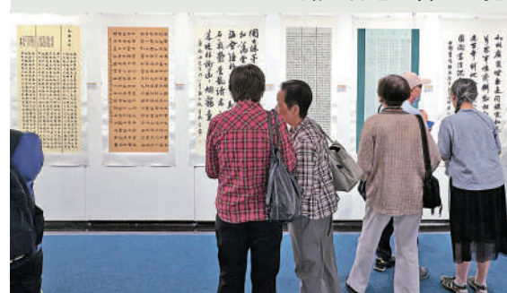
觀眾欣賞大賽優秀作品。