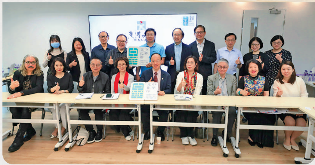
香港文聯昨日舉辦「中華文化節」項目新聞發布會。

香港文聯常務副會長霍啟剛表示，國家「十四五」規劃明確提出支持香港發展中外文化藝術交流中心，香港文聯未來的工作重點是在香港普及和傳承中華文化，弘揚愛國主義精神，思考怎樣借由香港文聯的人才資源優勢配合發展創意文化產業，將之打造成为香港「拚經濟」的支柱。他相信「中華文化節」只是一個開始，香港以後每年都會做得更好、更豐富。