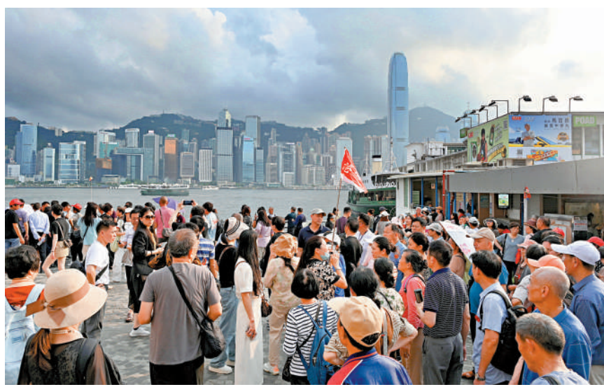
▲受惠於訪港旅客持續回升，本港服務輸出按年增長8.4%。