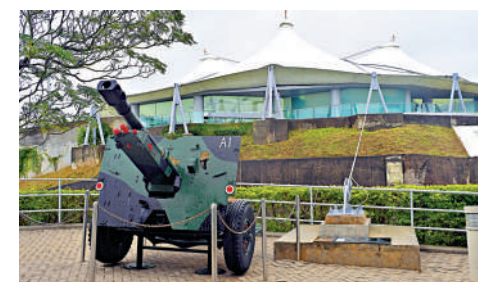
▲香港海防博物館將於9月3日改設為香港抗戰及海防博物館，市民可免費參觀。

改設博物館的修訂令於昨日刊憲，下周三提交立法會進行先訂立後審議程序。博物館改設後開放時間不變。查詢詳情可瀏覽博物館網頁或致電2569 1500。