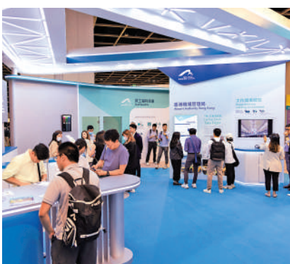
▲機管局和勞工處在會展舉辦機場職業博覽會。

【大公報訊】運輸及物流局局長林世雄昨日（17日）出席機場職業博覽會時表示，機管局本月起將啟動計劃，對所有合資格申請輸入外勞的公司，僱用的10個前線工種的本地員工，提供交通補貼，每名合資格的員工可獲每月最高400元，每月涉及的預算總額約為500萬元。