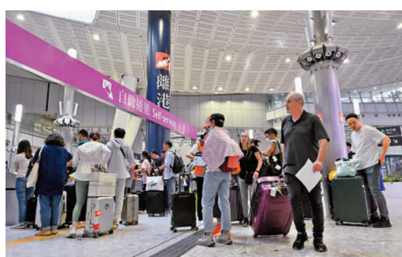
12對來往香港西九龍站及福田站的高鐵列車。

新增的列車班次車票由昨日開始發售，有關車票亦適用於「靈活行」即日變更車次安排，乘客跨境出行更方便及有彈性。乘客可留意12306官方網站或手機應用程式、高速鐵路網頁及手機應用程式發放的最新資訊。