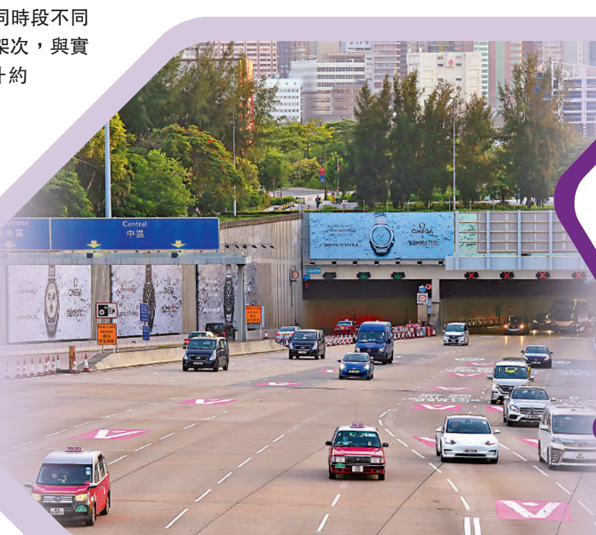
西隧使用率持續上升，全日車流量已超越紅隧。

林世雄強調，分時段收費是新安排，駕駛者需時適應，過海交通情況仍有可能出現反覆，運輸署將會持續收集數據一年，預計最快明年中檢視收費水平。