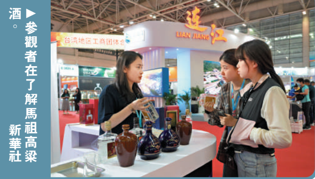
▶參觀者在了解馬祖高粱酒。中新社