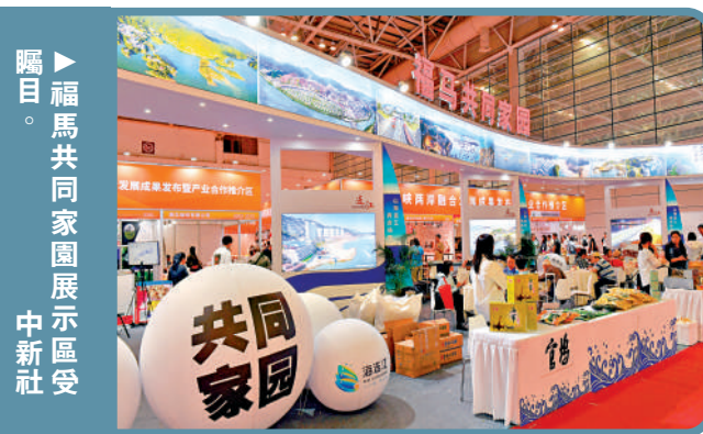
▶福馬共同家園展示區受矚目。