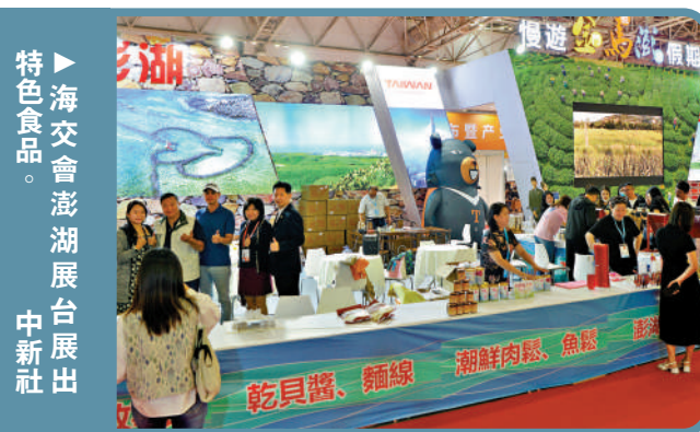
▶海交會澎湖展台展出特色食品。