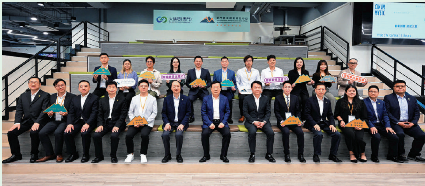
5月18日，夏寶龍主任考察澳門青年創業孵化中心，了解中心支持青年創業的服務、澳門的青年創業現況和機遇。

昨日上午，夏寶龍前往澳門青年創業孵化中心考察調研，在經濟財政司司長李偉農陪同下，了解中心支持青年創業的服務、澳門的青創現況和機遇。夏主任還到訪一家青創網絡科技企業，聽取其在特區政府支持下，由創業、發展、成長，以至現時邁向國際市場的故事。