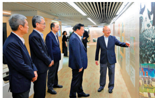
夏寶龍主任考察澳門日報社，參觀報社的歷史館。

陸波提到，由於《澳門日報》與葡萄牙的主流媒體《新聞日報》合作，每周推出「中國文化之窗」葡語專版，獲得夏主任推許，認為此舉可向葡萄牙宣傳中國文化及國家建設，有利於澳門與葡萄牙的溝通。