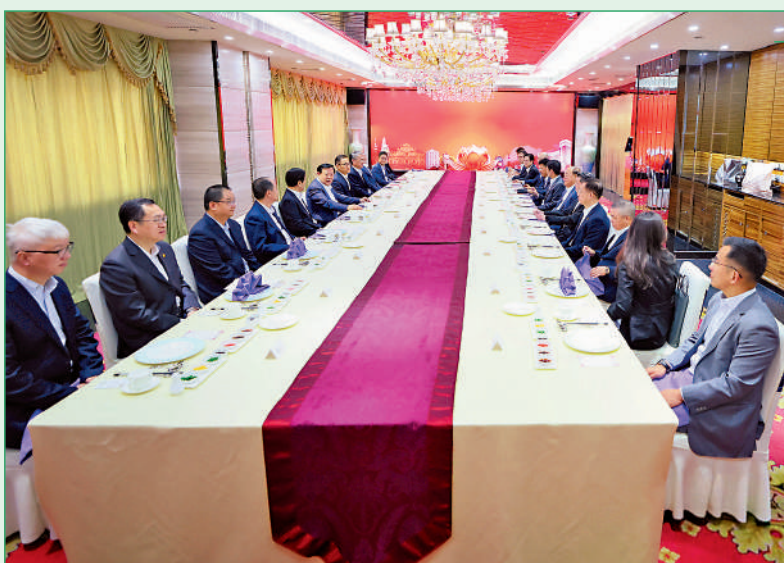
夏寶龍主任昨日與部分澳區全國人大代表、全國政協委員及省級政協聯誼會代表見面交流。