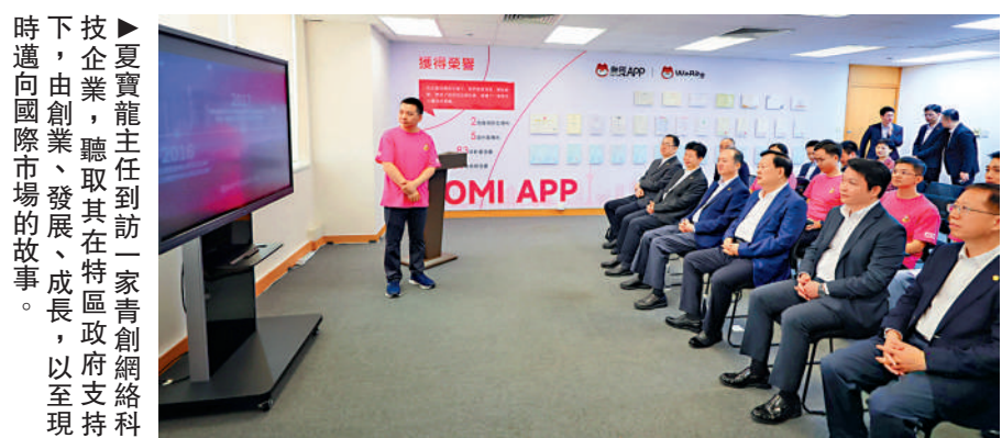
夏寶龍主任到訪一家青創網絡科技企業，聽取其在特區政府支持下，由創業、發展、成長，以至現時邁向國際市場的故事。

全國青聯常委、澳門青聯監事長何嘉倫表示，夏寶龍主任非常關心青年工作，高度讚揚澳門青聯的發展和工作，並對澳門青聯提出三點勉勵，一是做好政治思想引領，二是儲備人才，三是搭建更多平台，推動更多澳門青年融入國家發展大局。