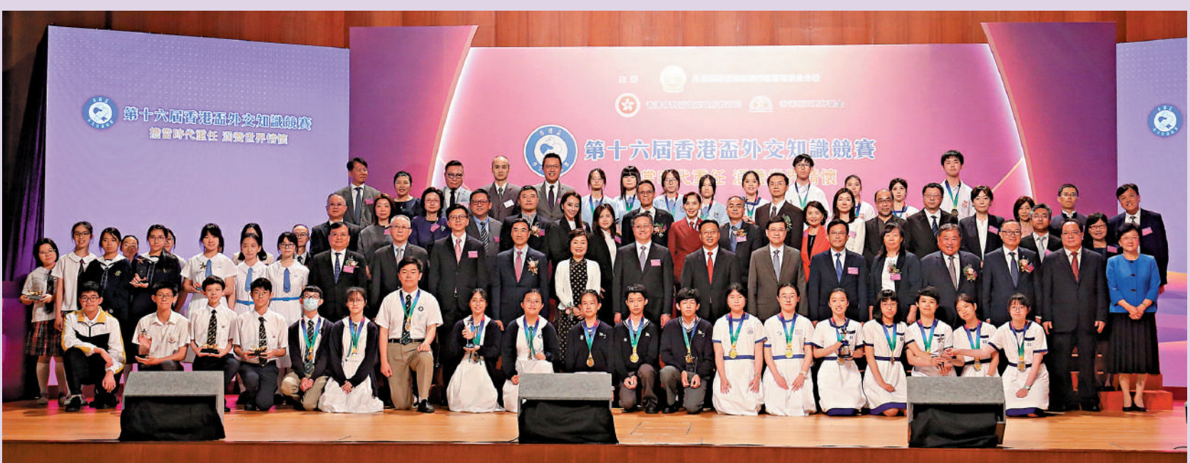
▲第十六屆「香港盃」外交知識競賽決賽暨頒獎典禮昨日舉行，一眾嘉賓與得獎者合照。

李家超致辭時表示，希望每一位香港青少年都能深入了解國家國情、歷史、文化，深刻認識世界和國家發展大勢，錘煉過硬本領，在變局中激發創新創造活力，為國家和香港的發展作出貢獻。崔建春用「三個C」概括對香港青年的三點希望：一是承諾 Commitment；二是貢獻 Contribution；三是交流 Communication，勉勵港青弘揚愛國主義精神，當愛國愛港的先鋒隊。