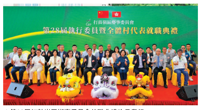
▲第28屆打鼓嶺區鄉事會就職典禮昨日舉行。

立法會議員劉業強，立法會議員、香港地方志中心總編輯、嶺南大學協理副校長劉智鵬教授為此書作序。