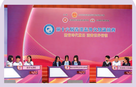
▲選手們進行緊張刺激的「問題搶答」環節。

「香港盃」外交知識競賽是由外交部駐港公署、特區政府教育局、香港明天更好基金聯合主辦的品牌公共外交活動，由香港賽馬會特別贊助，香港大公文匯傳媒集團、明報、香港電台、香港教育城、巴士的報協辦，國泰航空、聯合出版集團等擔任贊助機構。