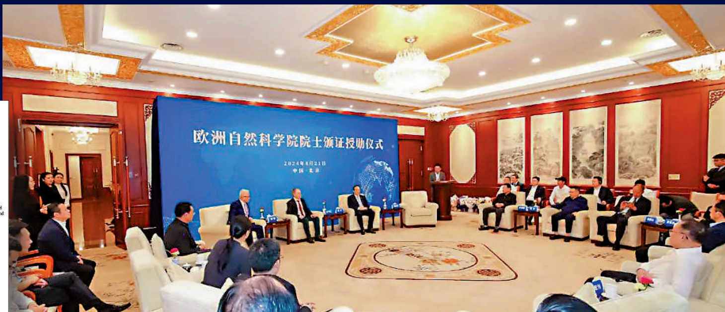
▲就歐洲自然科學院「洋院士」現象，中國科協官方微信表示，各部門機構不應為「投機者」捧場站台。圖為內地某機構為一位歐洲自然科學院院士舉行頒證授勳儀式。