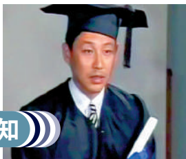
◀內地1990年電視劇《圍城》中陳道明飾演的方鴻漸。

另外，名稱上的相近使大眾以至學者都難以分辨一家組織的學術權威和口碑，其中最典型的是歐洲科學院(European Academy of Sciences)，其名稱與歐盟的官方顧問歐洲人文和自然科學院(Academia Europaea，也常譯為歐洲科學院)相近。2022年，國際知名學術期刊《自然》的網頁上就發表了一篇文章質疑European Academy of Sciences的性質，提醒學人留意。