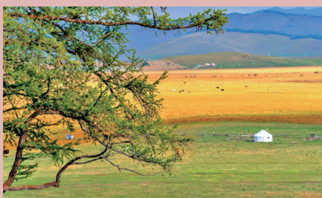
▲托勒海特大草原位於阿勒泰市阿拉哈克鎮，風光秀麗。

去，小河流過木橋，平緩舒暢。河心排列的卵石清潔而美麗。天空的雲霞向西流逝，拖出長長的、激動的流蘇。此刻的天空是飛翔的天空，整面天空都向西傾斜着。東面的大山金碧輝煌；抑或《木耳》裏的森林：「最綠的綠，是陰影的綠。陰影冰冷地沉在大地上，四處是濃厚濃黏的苔蘚，苔蘚下是一層又一層的、鋪積了千百萬年的落葉。走在森林裏，像是懸空走在森林裏一般，每一步踩下去，腳心都清晰地感觸着細膩而深邃的彈性。大地忽閃忽閃、動盪不已。於是走在森林裏，又像是掙扎在森林裏……」；還有《在荒野中睡覺》裏的雲：「沒有風的天空，有時會同時停泊着兩種不同的雲。一種如霧氣一般，又輕又薄，寬寬廣廣地籠罩住大半个天空，使天空明亮的湛藍成為柔和的粉藍。這種雲的位置較高一些。還有一種，要低許多，低得快要掉下來似的。這種雲是我們常見的一團一團的那種，似乎有着很瓷實的質地，還有着耀眼的白——真的，沒有一種白能夠像雲的白那樣白，耀眼