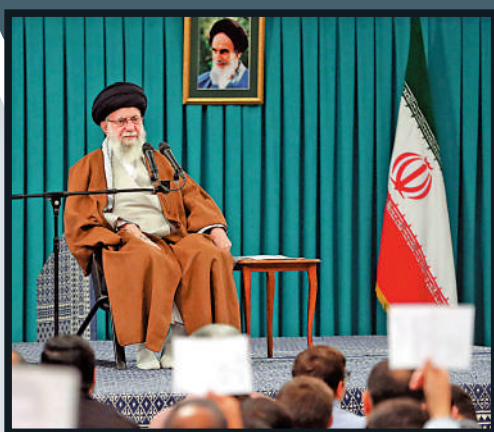
▲伊朗最高領袖哈梅內伊強調，該國政府機構的運轉不會受到影響。