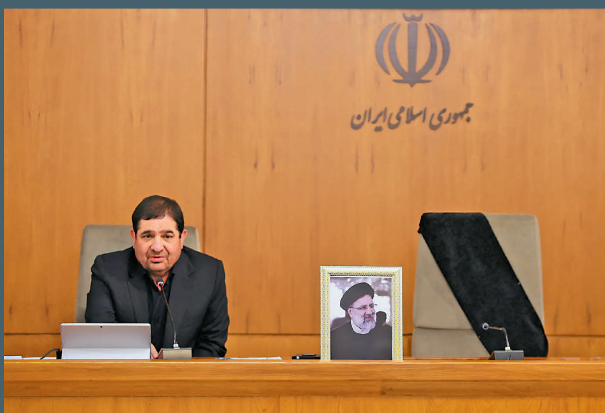
▲伊朗第一副總統穆赫貝爾出任臨時總統。他20日參加內閣會議，身邊屬於萊希的座位空置。

【大公報訊】哈梅內伊20日對萊希和阿卜杜拉希揚等人遇難表示哀悼，並強調伊朗政府機構的運轉不會受到影響，第一副總統穆赫貝爾將出任臨時總統。根據伊朗憲法，穆赫貝爾和伊朗議會議長、伊朗司法部長組成的委員會必須在50天內安排新的總統選舉。伊朗政府發言人賈赫魯米宣布，伊朗首席核談判代表、副外長巴蓋里被任命為代理外長。萊希2021年當選總統，下一屆選舉原定於2025年舉行。