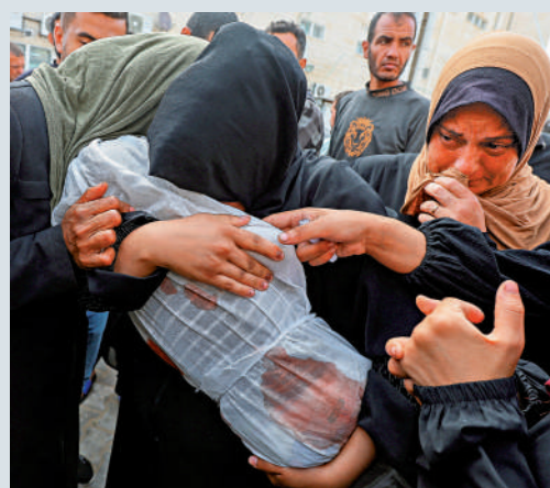
▲加沙民眾19日抱着死於以軍襲擊的兒童遺體哭泣。

請，要求對內塔尼亞胡、加蘭特、哈馬斯加沙地帶領導人辛瓦爾、哈馬斯下屬武装派別卡桑旅領導人馬斯里和哈馬斯政治局領導人哈尼亞發出逮捕令。他對內塔尼亞胡和加蘭特的指控主要包括將飢餓作為戰爭手段，例如拒絕人道主義救援物資進入加沙，以及故意針對加沙平民的襲擊和集體懲罰行為；對哈馬斯的指控則包括謀殺、劫持人質、實施酷刑等。