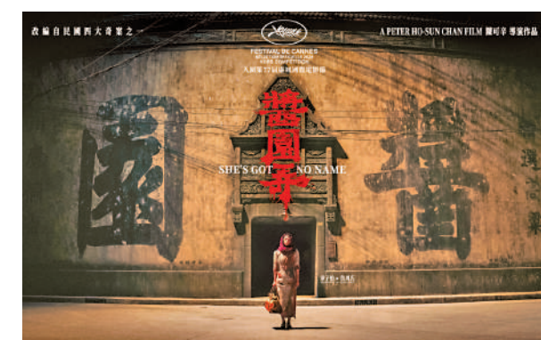
◀《醬園弄》將於5月24日康城首映。