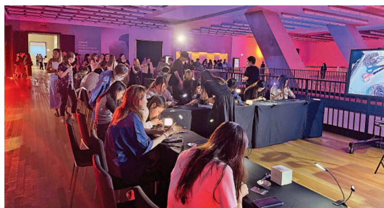
◀觀眾在場內體驗穿珠仔工作坊。