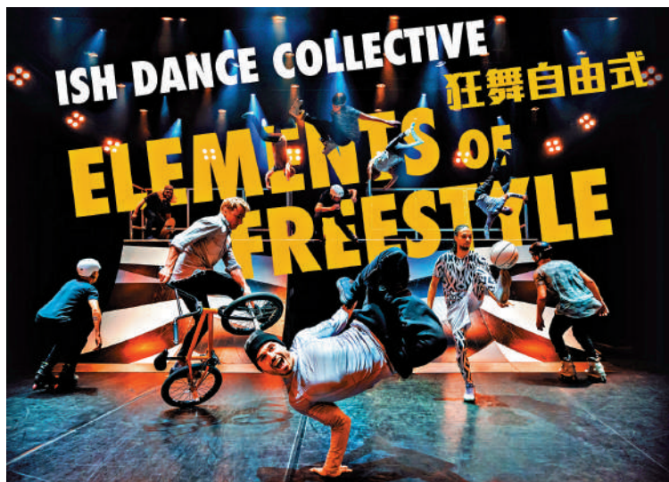
◀《狂舞自由式》將於6月28至30日在自由空間大盒上演。

西九文化區自由空間首度化身為街頭運動表演場地，邀請來自荷蘭阿姆斯特丹、致力開拓街頭文化藝術視野的著名藝術團隊ISH Dance Collective呈獻