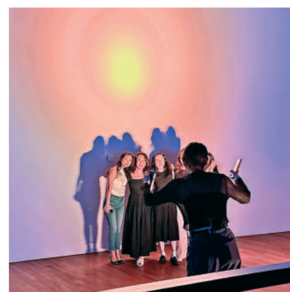
◀位於二樓的燈光打卡位，與好友一起拍照留念。