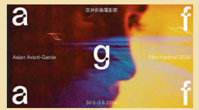
▲M+即將舉辦亞洲前衛電影節。

M+首屆「亞洲前衛電影節」將重點展示過去60年來亞洲多元化的流動影像作品，它們塑造了這個地區豐富的藝術面貌。電影節期間將舉辦一連串精彩放映、展覽導賞、表演、講座、工作坊和現場演出，包括亞洲各地的獨立藝術和電影製作。觀眾可體驗各式各樣的流動影像實踐，它們跨越主流藝術和電影界限、挑戰主流歷史敘事，同時拓展視覺表達的無盡可能。