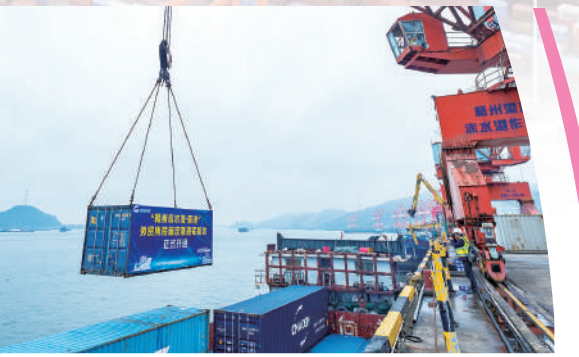
▲2024年3月14日，隨着執行首航任務的「寧通938」輪在梧州赤水港靠泊進行裝卸作業，標誌着北部灣港集團首條「梧州—香港」外貿集裝箱班輪航線正式開通，開啓了與香港間「一船通達」的新階段。

機產品認證示範創建區通過驗收，累計286家企業455款產品獲得國家有機產品認證證書。梧州茉莉花、梧州六堡茶、桂林羅漢果、昭平紅茶、融安金桔、容縣沙田柚等廣西地方特色有機綠色產業迅速發展。