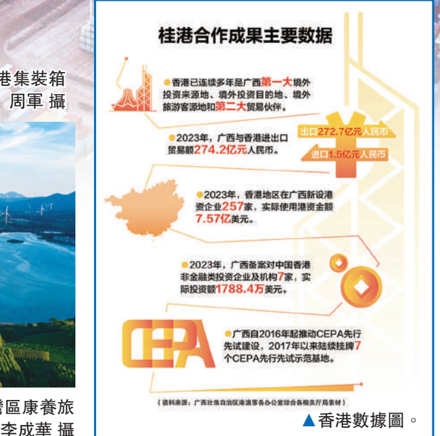
▲香港數據圖。圖為廣西欽州港集裝箱碼頭裝卸作業一派繁忙。

▲2023年，粵港澳地區「西部陸海新通道」陸海聯運班列開行2566列，同比增長18.3%。