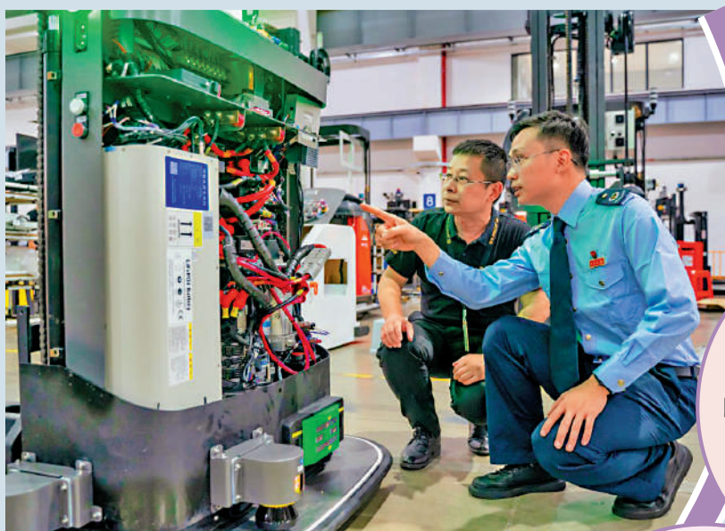
▲廣東稅務部門將稅費服務事項延伸至香港，穗港深「三地通辦」已成為現實。圖為港企鴻利達中山智能化車間。