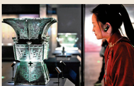
▲參觀者在殷墟博物館新館內參觀。

門票信息 門票價格：80元人民幣。60周歲（含）以上老年人憑身份證免費；身高1.4米（含）以下兒童免費。人民教師憑有效證件；18周歲（含）以下未成人、全日制大學本科及以下學歷學生，憑有效證件享受半價優惠。殷墟和紅旗渠等國家5A景點對港人免費入場。 ●預約方式：個人觀眾可至多提前7天在殷墟博物館微信公眾號、殷墟景區公眾號預約，每天分為以下三個預約入館時段：8:30-11:30、11:30-14:30、14:30-16:30。 ●開館時間：8:30-17:30（16:30停止售票），全年無休（臨時公告閉館除外）。 大公報記者劉蕊整理