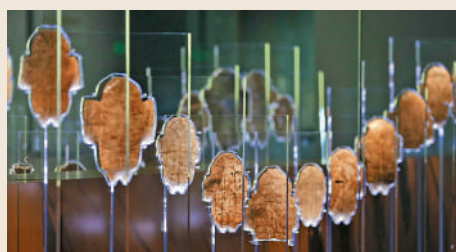
▲殷墟博物館新館內展出的甲骨。