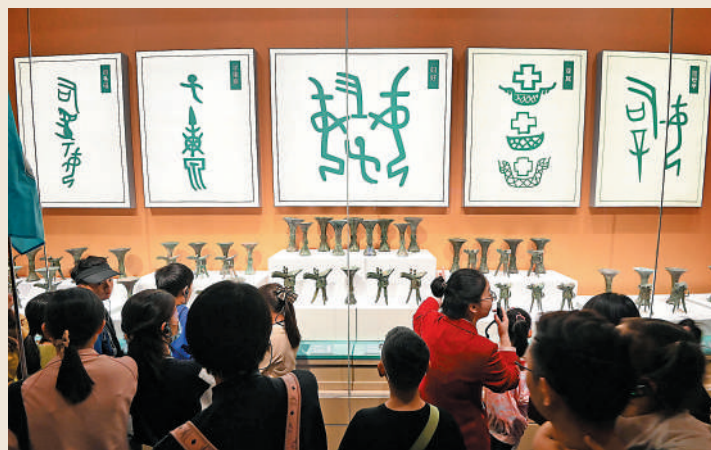
▲2024年5月3日，遊客在殷墟博物館新館參觀。

甲骨文是漢字的源頭。漢字經甲骨文、金文、篆書、隸書、草書、楷書、行書一路變革，從未間斷。在已知的世界四大古文字體系中，唯有以殷墟甲骨文為代表的中國古文字體系，穿越時空，將生命延續至今。習近平總書記在致甲骨文發現和研究120周年的賀信中指出：「甲骨文是迄今為止中國發現的年代最早的成熟文字系統，是漢字的源頭和中華優秀傳統