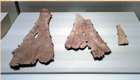
▲香港歷史博物館現正展出夏商周三代出土文物，其中就涵蓋商代後期的甲骨文文物。