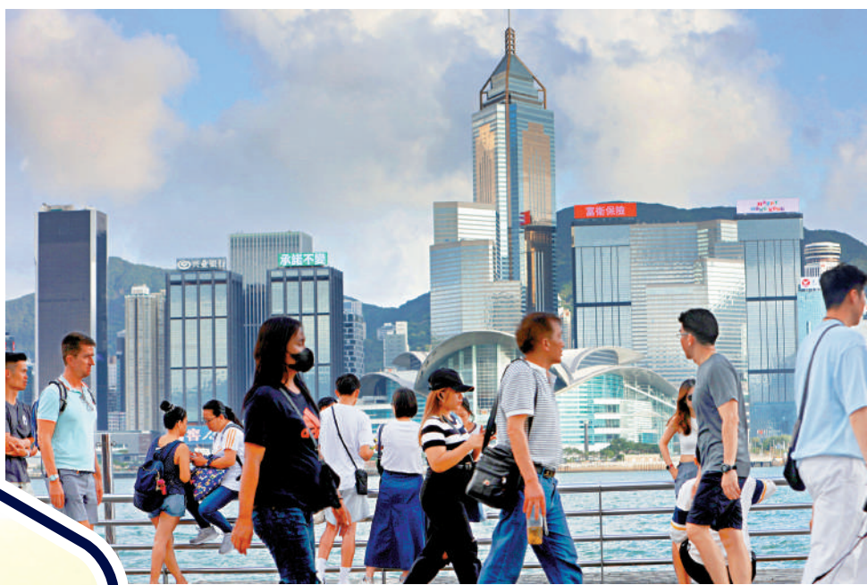
▲李澤鉅表示，愈多國際企業與家族辦公室來港，本港國際金融中心地位只會愈加鞏固。

對於市場有意見，擔憂新加坡會挑戰香港國際金融中心地位，中華股權投資協會（CVCA）創始人兼名譽理事長、TPG資本中