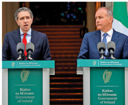
▲愛爾蘭總理哈里斯（左）和外長馬丁22日見記者。

【大公報訊】挪威首相斯特勒22日表示，挪威將支持給予巴勒斯坦聯合國正式會員國地位。挪威外交大臣艾德指出，希望承認巴勒斯坦國的決定能夠鼓勵巴以雙方重啟和平談判，目前最緊迫的是在加沙地帶盡快實現停火，確保足夠的人道主義援助到達加沙人民手中。