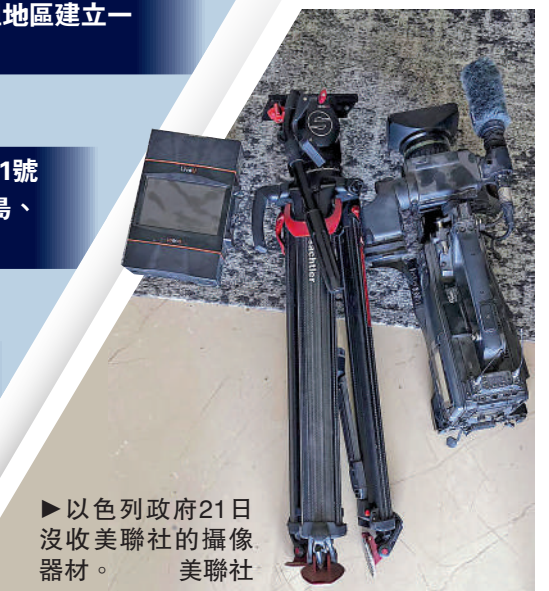
▶以色列政府21日沒收美聯社的攝影器材。