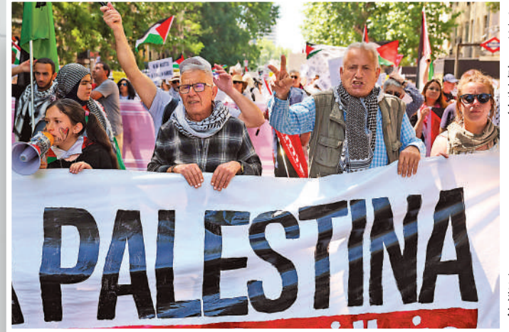
▲民衆5月11日在西班牙馬德里遊行，支持巴勒斯坦。