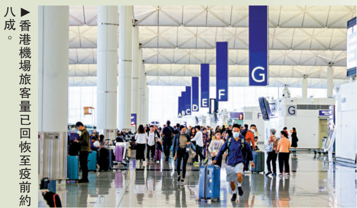
▶香港機場旅客量已恢復至疫前約八成。