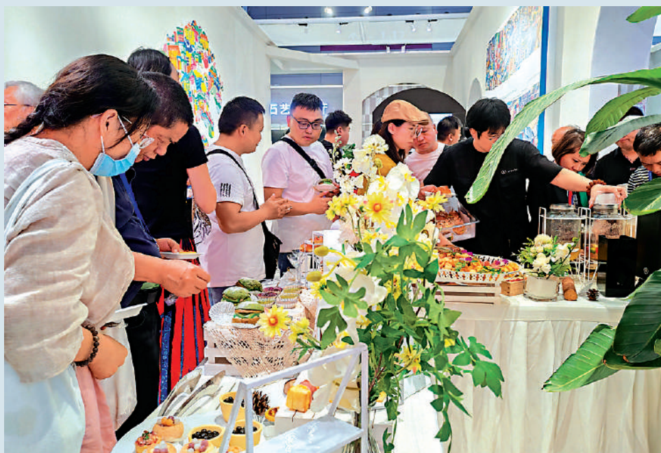
5月23日，為期5天的第二十屆中國（深圳）國際文化產業博覽交易會開幕。圖為文博會現場，帶有香港風味的小吃和奶茶吸引了大批觀眾品嘗。

首次設立「文創中國」專題展區、打卡2024央視春晚同款《詠春》、現場追劇《慶餘年》第二季、不經意間邂逅陳麗君、李雲霄等名人……5月23日，第二十屆中國（深圳）國際文化產業博覽交易會（下稱「文博會」）在深圳國際會展中心舉行。邁入弱冠之年的文博會，吸引來了6015家參展單位，展出文化產品超過12萬件。香港代表團繼2008年首次亮相以來，連續16年參加文博會。在粵港澳大灣區文化產業創新展館香港展區（下稱「香港館」）內，9位香港設計師及9個香港品牌的約300件展品，展示了香港文創產業的最新成就。