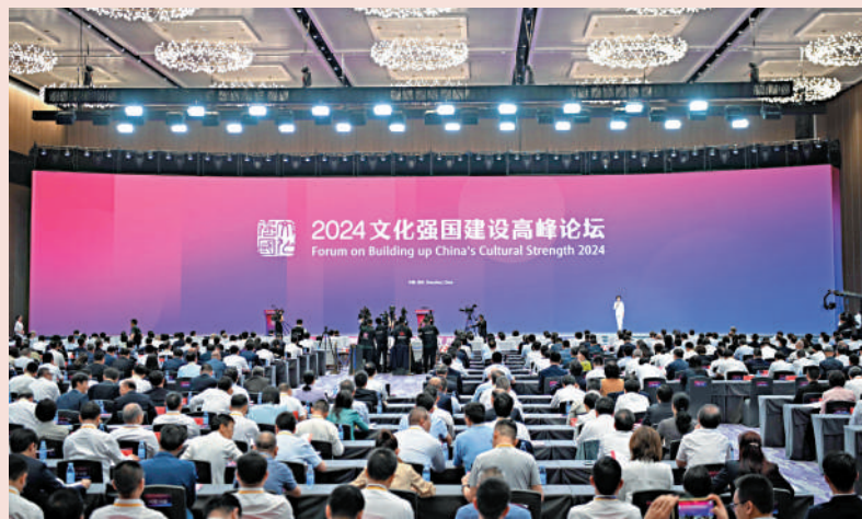
5月23日，2024文化強國建設高峰論壇在廣東深圳舉辦，中央宣傳文化單位、各省區市和新疆生產建設兵團黨委宣傳部、部分文化企業事業單位有關負責同志和有關智庫專家學者等參加論壇。

本屆論壇主題為「中國式現代化與新的文化使命」，由中宣部主辦。本屆論壇分為主論壇和8個分論壇。分論壇涵蓋文藝創作、全媒體傳播體系建設、文化遺產保護、文化產業創新發展、出版人才培養、電影業高質量發展、文化貿易高質量發展和人文灣區建設等主題。中央宣傳文化單位、各省區市和新疆生產建設兵團黨委宣傳部、部分文化企業事業單位有關負責同志和有關智庫專家學者等參加論壇。