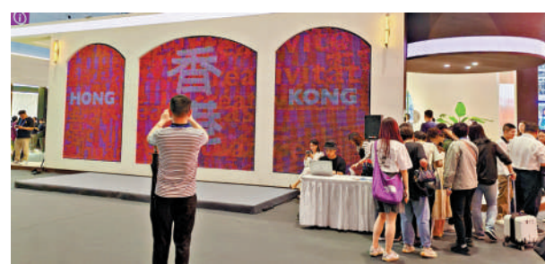
粵港澳大灣區文化產業創新展香港展區。

首次設立「文創中國」專題展區、打卡2024央視春晚同款《詠春》、現場追劇《慶餘年》第二季、不經意間邂逅陳麗君、李雲霄等名人……5月23日，第二十屆中國（深圳）國際文化產業博覽交易會（下稱「文博會」）在深圳國際會展中心舉行。邁入弱冠之年的文博會，吸引來了6015家參展單位，展出文化產品超過12萬件。香港代表團繼2008年首次亮相以來，連續16年參加文博會。在粵港澳大灣區文化產業創新展館香港展區（下稱「香港館」）內，9位香港設計師及9個香港品牌的約300件展品，展示了香港文創產業的最新成就。