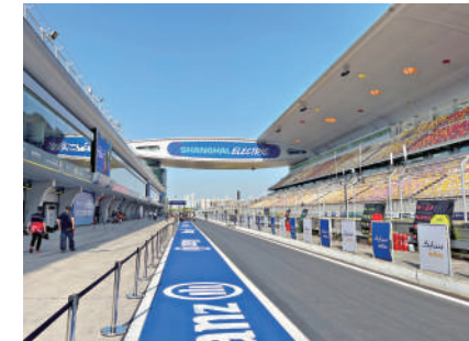
▲國際汽聯電動方程式世界錦標賽（FE）上海站比賽本周末揭幕。

【大公報訊】記者夏微上海報道：24日，上海國際賽車場再度迎來賽車的轟鳴聲。作為世界上第一項純電動的國際汽聯世界錦標賽，也是唯一獲得淨零碳認證的運動項目，國際汽聯電動方程式世界錦標賽（FE）時隔五年重返中國，並首度登陸上海。24日，一場不對公眾開放的一練伴隨着餘暉在上海國際賽車場進行。來自