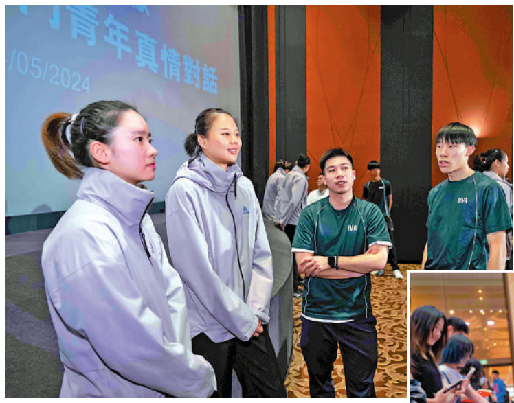
▲中國女排成員與澳門年輕運動員分享奮鬥故事。