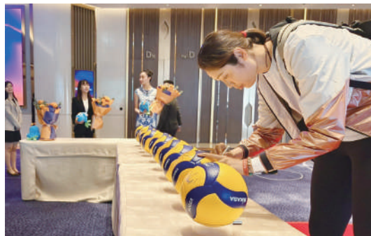
▲朱婷在歡迎儀式的排球上簽名。

深受球迷喜愛的中國女排率先抵澳備戰，主教練蔡斌帶領球員抵達，朱婷、袁心玥、張常寧、龔翔宇等於銀娛旗下銀河國際會議中心展覽館入口參加歡迎儀式。體育局代局長林蓮嬌、中國澳門排球總會理事長馬志成；銀河娛樂集團董事程裕昇、企業事務董事林志成等嘉賓在現場，迎接一眾運動健兒。