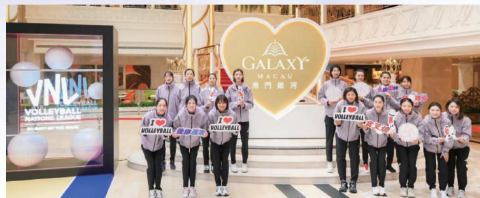
中國女排抵澳為賽事積極備戰，亦於「澳門銀河」東翼廣場合照留念。

睽違4年，「世界女排聯賽」再度重臨澳門。由國際排球聯合會授權，澳門特別行政區政府體育局、銀河娛樂集團及中國澳門排球總會主辦的「銀河娛樂集團世界女排聯賽澳門2024」將於5月28日至6月2日在澳門最新最大的室內綜藝館—銀河綜藝館舉行。