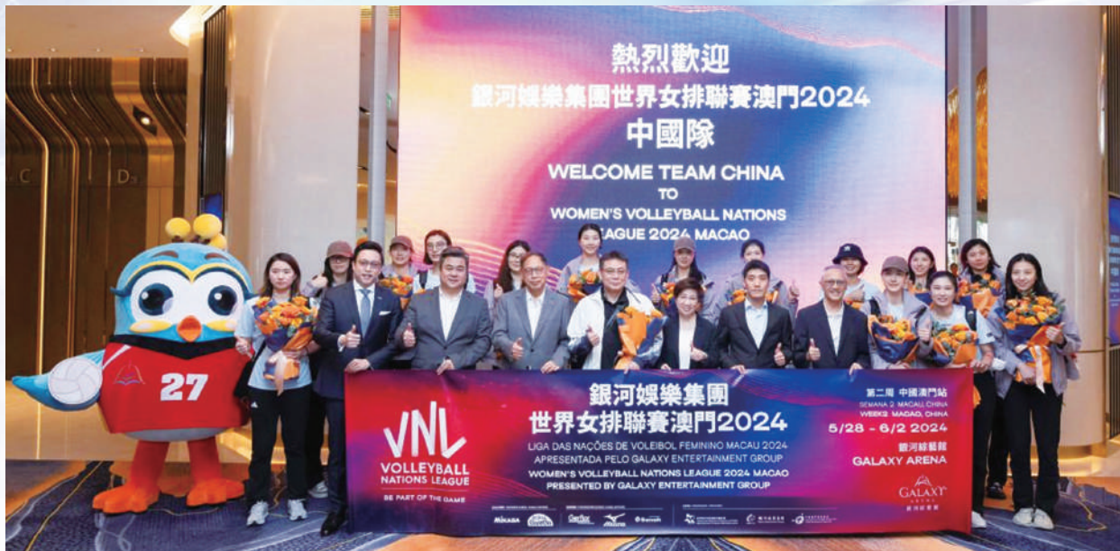
一眾嘉賓熱烈歡迎中國女排抵澳。

為了迎接賽事，銀娛除了提供世界級的場地硬件及配套设施外，亦攜手其他主辦方舉辦不同類型的延伸活動，從中融入各項精彩元素，結合排球及澳門的多元文化特色，讓澳門市民及國際旅客提前感受女排盛事的熱烈氛圍及排球樂趣，助力展現澳門「旅遊+體育」跨界融合的聯動優勢，豐富澳門「世界旅遊休閒中心」定位的內涵。