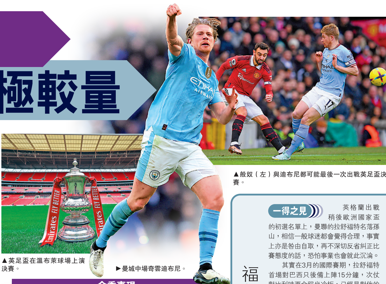
▲般奴(左)與迪布尼都可能最後一次出戰英足盃決賽。