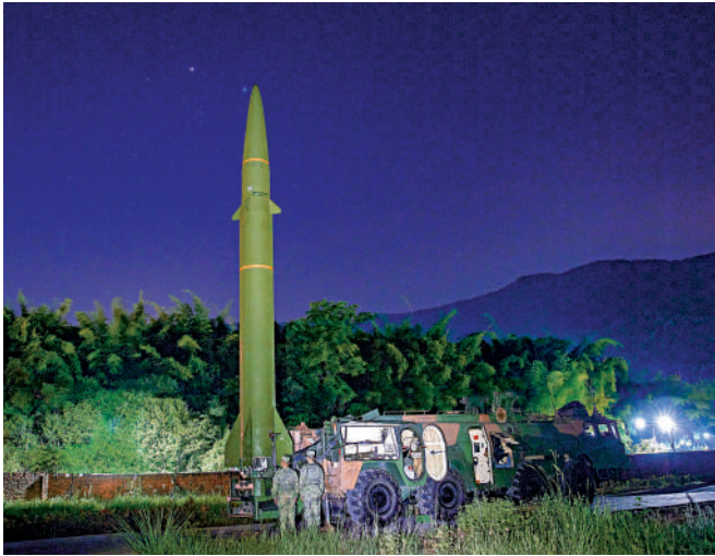
▲火箭軍某發射梯隊星夜展開模擬火力打擊。