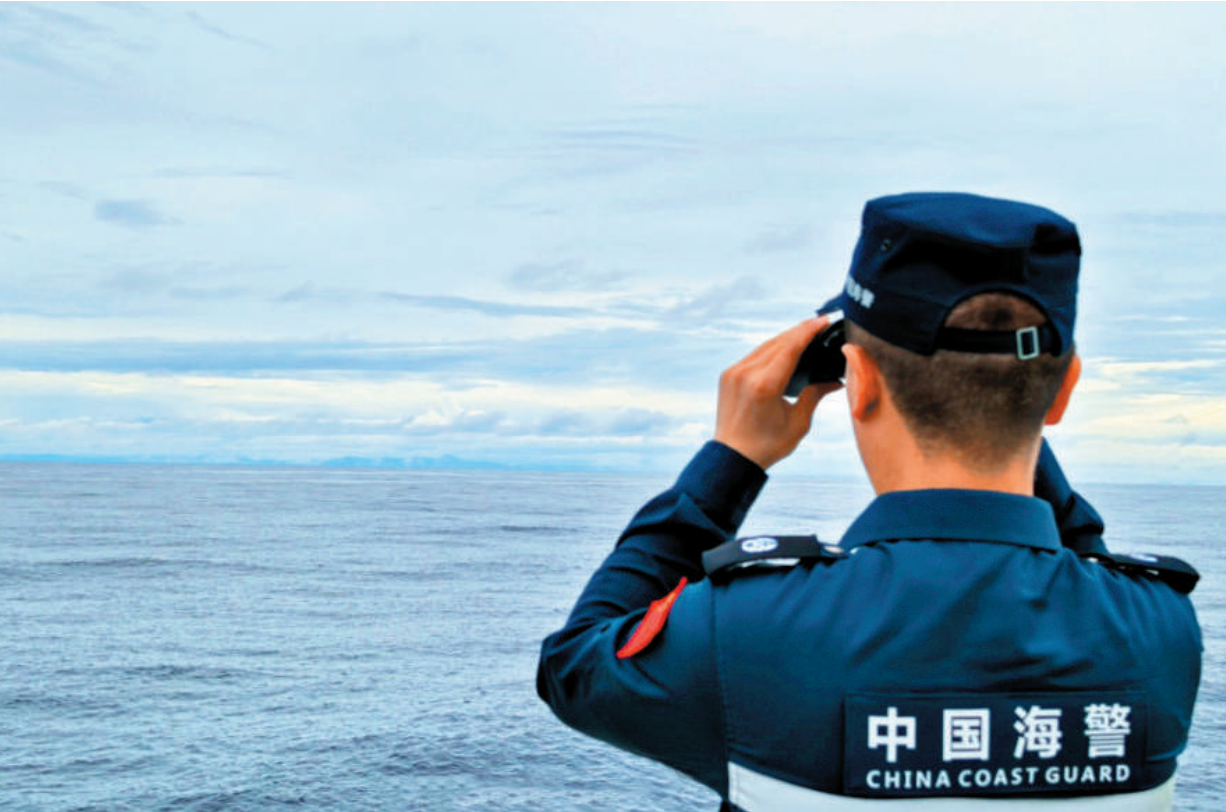
▲軍警協同是解放軍今次演練的一大突破。在中國海警發布的其中一張行動說明配圖，可以清晰地看見台灣本島的中央山脈。