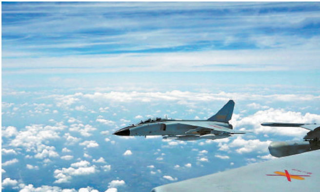
▲航空兵殲轟機帶彈進行演習。