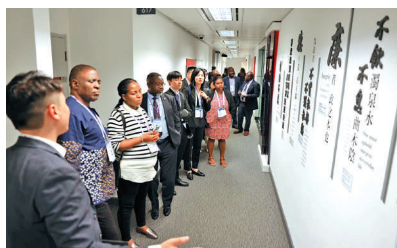
▲與會人士到廉署總部參觀，了解廉署執法、防貪及倡廉工作。

連三日在香港舉行的「廉政公署第八屆國際會議」昨日閉幕，發表《加強國際合作預防和打擊貪腐香港宣言》。