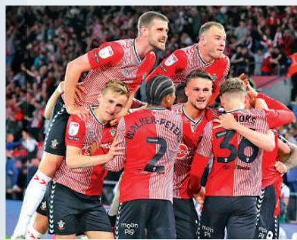
修咸頓淘汰西布朗晉級。