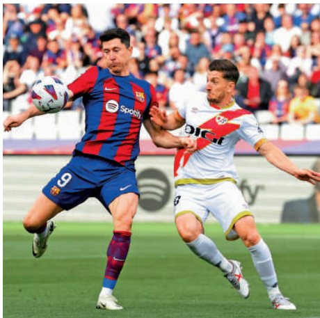
巴塞射手利雲度夫斯基（左）希望贏波報答球迷支持。