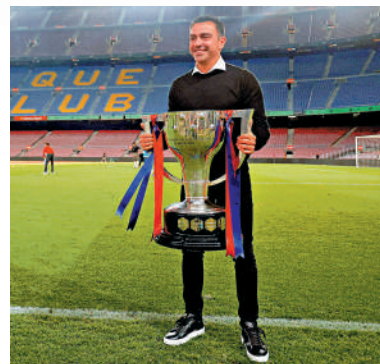
沙維被炒，料會引發巴塞球迷不滿。