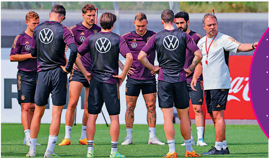
費力克（右）曾執教德國隊和拜仁。