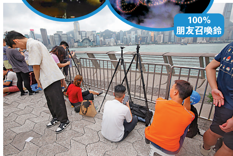
▲昨日下午四時已見有市民和遊客提前「霸位」等看無人機匯演。