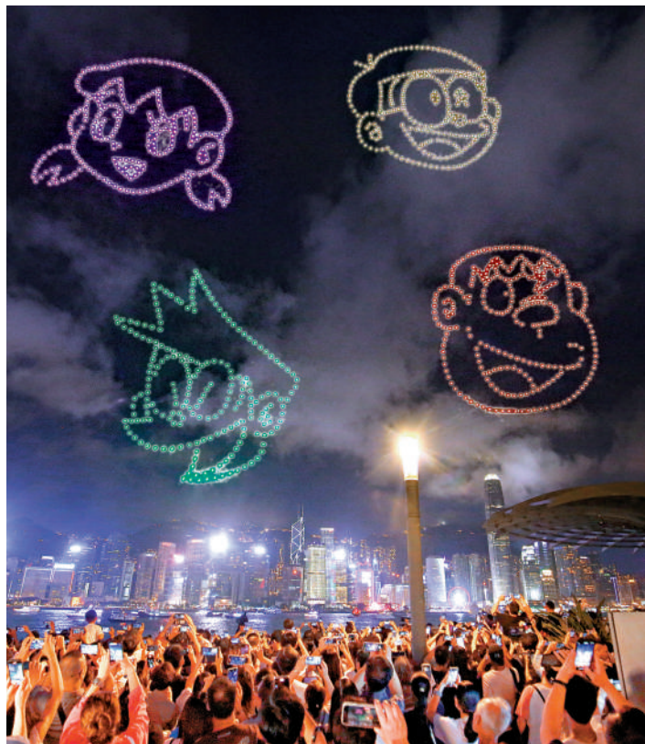
▲多啦A夢與好朋友飛越維港。