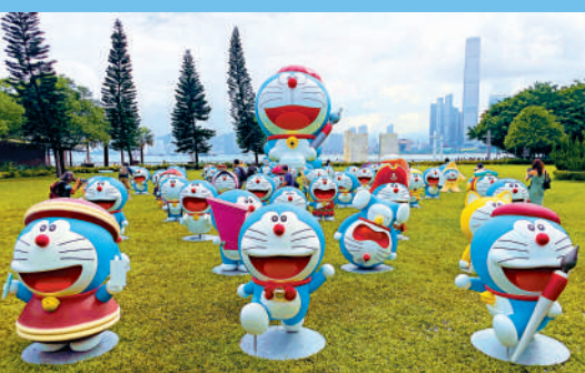
▲12米高的充氣多啦A夢，以及60個多啦A夢雕塑，昨日快閃現身中山公園。