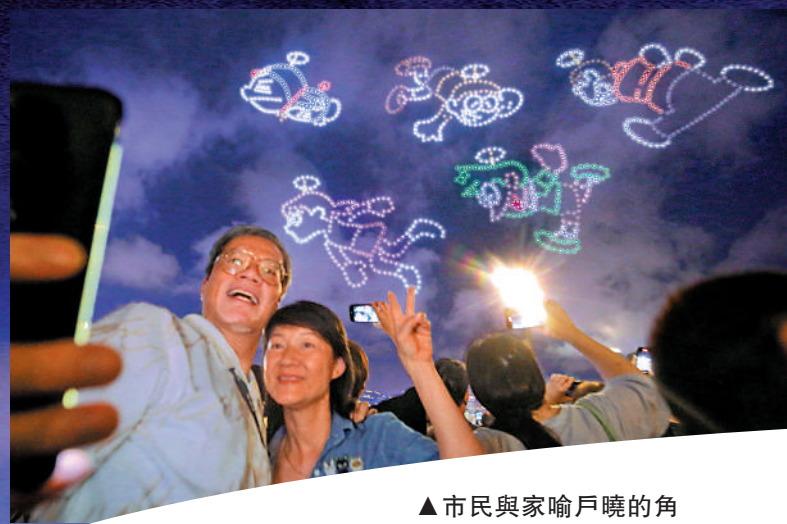
▲市民與家喻戶曉的角色打卡，留下美好回憶。

◀昨夜維港舉行無人機匯演，多啦A夢閃亮現身，市民和遊客歡喜若狂。