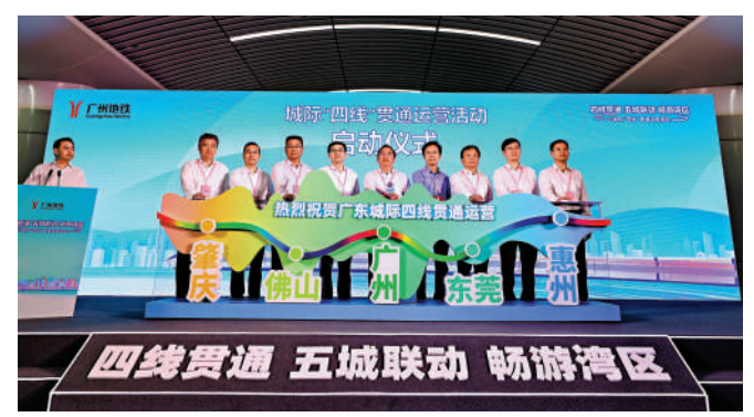
▲26日，廣東城際「四線」貫通運營啟動儀式在城際鐵路番禺站舉行。

廣州地鐵集團宣傳部負責人表示，「四線」貫通運營，相當於粵港澳大灣區有了一條「最長地鐵」，能夠有效加強廣州、佛山、肇慶、東莞、惠州等城市的聯繫，通過「地鐵化」的城際鐵路，推動形成「一體化」的大灣區，助力打造「一張網、一張票、一串城」的交通發展新格局，逐步實現「粵港澳大灣區1小時生活圈」。 值得關注的是，隨著「首條可實現粵港澳大灣區城際與廣州地鐵網互聯互通的軌道交通項目」——南珠（中）城際的建成開通、並與廣州地鐵18號線實現兩條線路貫通運營後，城際線路將深入廣州市區。遠期，南珠（中）城際將與深南中城際的銜接貫通運行，廣州市民可以通過廣州地鐵直達深圳市中心乃至深港口岸而連通香港。