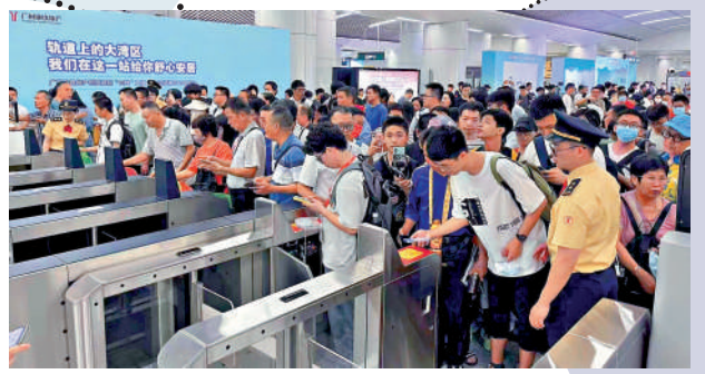
▲無需提前購票，市民搭乘城際鐵路與地鐵一樣便捷。