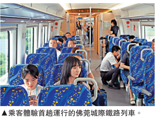
▲乘客體驗首趟運行的佛莞城際鐵路列車。新華社

其中，疊加廣州南站以及城際番禺站的輻射，廣州番禺區也真正成為「大灣區的十字路口」。番禺往北對接廣州珠江新城、琶洲、萬博商務區，往南連接南沙自貿區，形成對內串聯CBD商務中心，對外輻射佛山、東莞。業界人士稱，番禺在大灣區此一輪基建潮中成為最大贏家之一，將帶動生產要素和資源的流通和集聚，促進區域經濟增長。