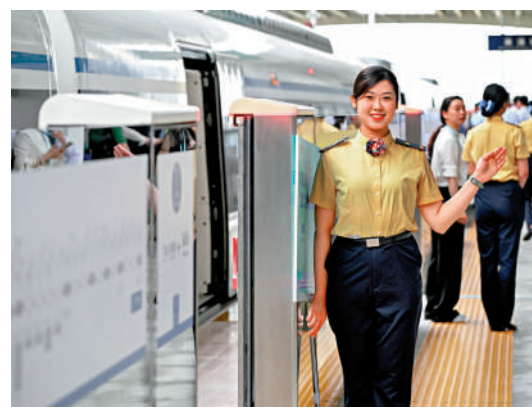
▲乘務人員在佛莞城際鐵路東莞麻涌站指引乘客。

大灣區抓緊推進軌道交通「四網融合」（幹線鐵路、城際鐵路、市域鐵路和城市軌道）試點落地，打造軌道上的城市群都市圈。香港作為大灣區的主要城市，如何加快互聯互通，對接新格局，關乎未來發展。