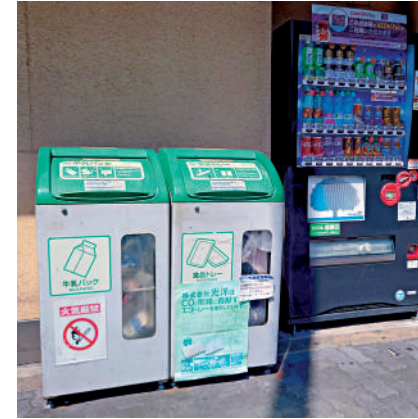
▲日本垃圾分類配套較完善，而且當地人從小就培養分類回收意識。