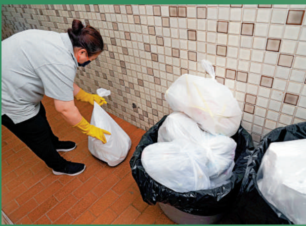
▲幼稚園每日產生用過的尿片、廚餘、教學用品等垃圾，數量不少。