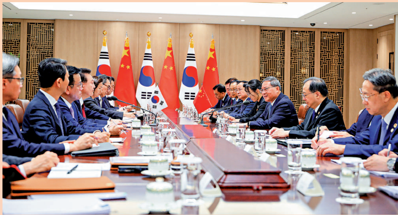
當地時間5月26日下午，國務院總理李強在首爾出席第九次中日韓領導人會議期間會見韓國總統尹錫悅。

李在鎔介紹了三星集團在華投資合作情況，感謝中國政府為三星在華生產經營提供的大力支持，表示三星將堅持在華發展，致力於做中國人民喜愛的企業，繼續為韓中互利合作作出自己的貢獻。