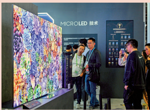
▲三星電視亮相第六屆中國國際進口博覽會，吸引觀眾。