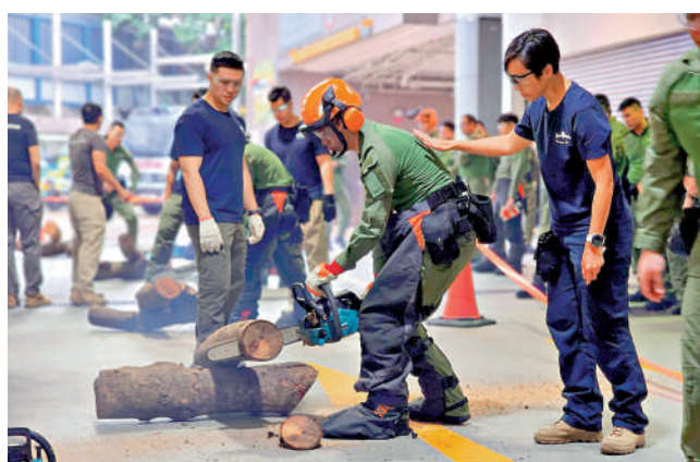
警方新界南總區訓練演習，提升應對極端天氣突發情況的能力。