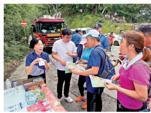
警方與跨部門人員在獅子山郊野公園進行行山遠足安全宣傳。

市民切勿單獨遠足行山，宜多人同行；在出發前應了解路線資料，按路線沿途的路面狀況、行程所需時間、自己和同行者的能力及身體狀況，選擇最合適的路線，細心計劃行程；途中不要隨意離開原定路線，或步入沒有路牌指示的叢草或樹