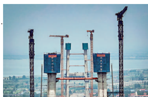
▲湖北省鄂州市拍攝的新港高速公路雙柳長江大橋南主塔施工現場。