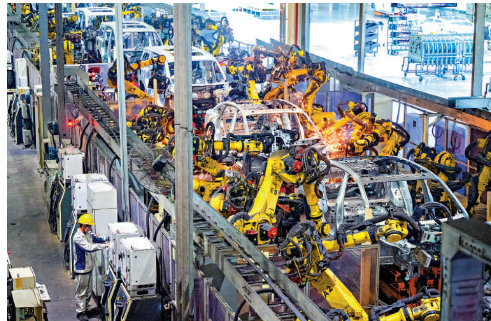
▶5月27日，中共中央政治局召開會議強調，推動中部地區崛起取得新的重大突破。圖為4月1日，在位於湖北武漢市經開區的風圖汽車電動化焊裝車間，機器人在流水線上作業。