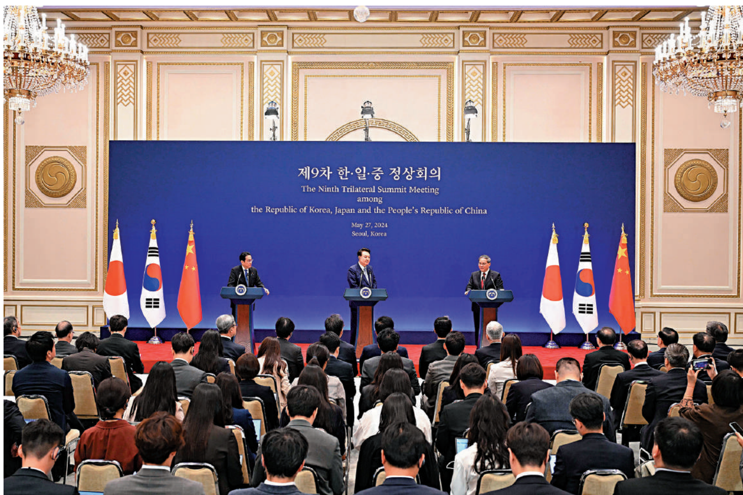
▲當地時間5月27日上午，國務院總理李強在首爾與韓國總統尹錫悅、日本首相岸田文雄共同出席第九次中日韓領導人會議。這是會後，三國領導人共同會見記者。

【大公報訊】據新華社報道：李強就深化中日韓合作提出五點建議：一是推動合作全面重啟，尊重彼此核心利益與重大關切，充分激活合作存量，穩步培育增量，形成雙邊關係和三國合作相互促進。二是深化經貿互聯互通，維護產業鏈供應鏈穩定暢通，盡早恢復並完成中日韓自貿協定談判。三是引領科技創新合作，加強協同創新和前沿領域合作。中方將在華建立「中日韓創新合作中心」，助力三國加快培育新動能。四是拉緊人文交流紐帶，以舉辦中日韓文化交流年為契機，推動三國人民實現從「居相鄰」到「心相通」。五是努力促進可持續發展，加強低碳轉型、氣候變化、老齡化和應對流行病等領域交流合作，發掘和開展更多「中日韓+X」合作項目。