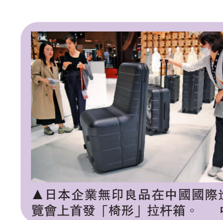
▲日本企業無印良品在中國國際進口博覽會上首發「椅形」拉杆箱。

李強指出，當前朝鮮半島局勢持續緊張，各方要發揮建設性作用，致力於緩和局勢，早日重啟對話，推動半島問題政治解決進程向前邁進，維護地區和平穩定。中日韓要用好各自發展優勢，積極對接東盟等地區國家需求，打造區域合作新引擎。要攜手提振東盟與中日韓（10+3）合作勢頭。中方願同韓方、日方一道積極推動構建人類命運共同體，攜手維護地區和世界的長治久安。