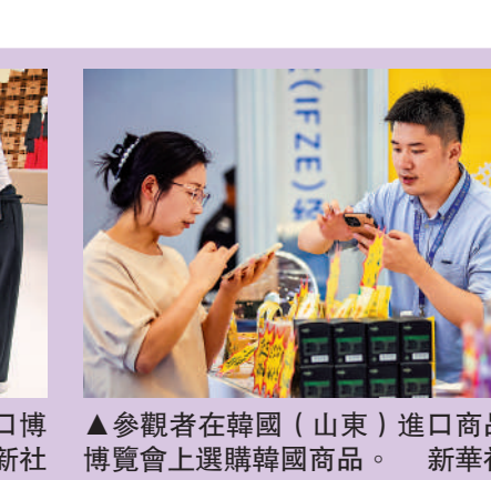
▲參觀者在韓國（山東）進口商品博覽會上選購韓國商品。

會後，三國領導人共同會見記者。李強表示，面對新挑戰、新機遇，中日韓合作要展現新擔當、新作為。中方願以此次領導人會議為契機，同韓方、日方一道，推動中日韓合作行穩致遠。三方發表《第九次中日韓領導人會議聯合宣言》《中日韓知識產權合作十年願景聯合聲明》《關於未來大流行病預防、準備和應對的聯合聲明》，一致同意致力於落實第八次領導人會議通過的《中日韓合作未來十年展望》，推動中日韓三國合作機制化，在東盟與中日韓等多邊框架內保持密切溝通合作，共同維護世界和平穩定與發展繁榮。三方同意將2025-2026年定為中日韓文化交流年。吳政隆出席上述活動。5月27日下午，國務院總理李強在結束出席在韓國舉行的第九次中日韓領導人會議後，乘包機回到北京。國務委員兼國務院秘書長吳政隆等陪同人員同機抵達。離開首爾時，韓國政府高級官員和中國駐韓國大使邢海明等到機場送行。