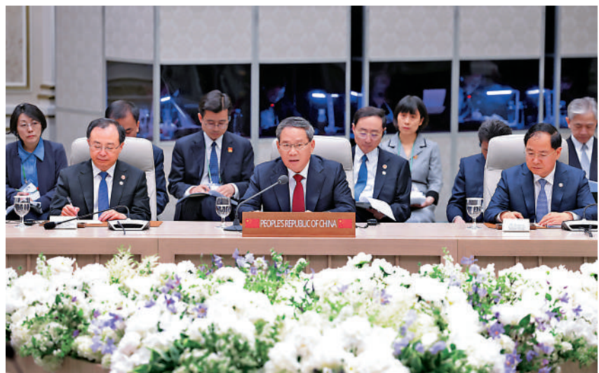
▲當地時間27日上午，國務院總理李強在首爾與韓國總統尹錫悅、日本首相岸田文雄共同出席第九次中日韓領導人會議。

當地時間5月27日上午，國務院總理李強在首爾與韓國總統尹錫悅、日本首相岸田文雄共同出席第九次中日韓領導人會議。李強表示，今年是中日韓合作機制建立25周年。在新的起點上，中日韓要堅守合作初心，堅持開放包容、互尊互信、互惠互利、交流互鑒，共同推動中日韓合作整裝再發、換擋提速，邁向全面發展的新征程，為地區繁榮穩定作出更大貢獻。