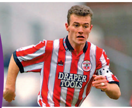
▲英格蘭足球名宿舒利亞。

加盟利物浦前同樣效力修咸頓的華基爾雲迪積克和沙迪奧文尼，就是修咸頓分別從蘇超些路迪和奧地利的薩爾斯堡兩個歐洲三線聯賽收購，兩人接連助利物浦贏取歐聯和英超，雲迪積克曾在世界足球先生取得第2名，而文尼就曾當選非洲足球先生。利物浦另一位來自修咸頓的功臣洛夫雲，當年就是後者從法甲里昂收購，他亦是克羅地亞在2018年世界盃勇奪亞軍的主力。