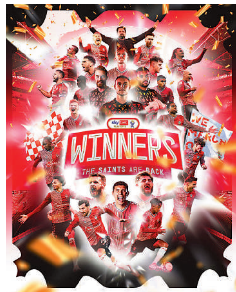
▲修咸頓升班的慶祝海報。