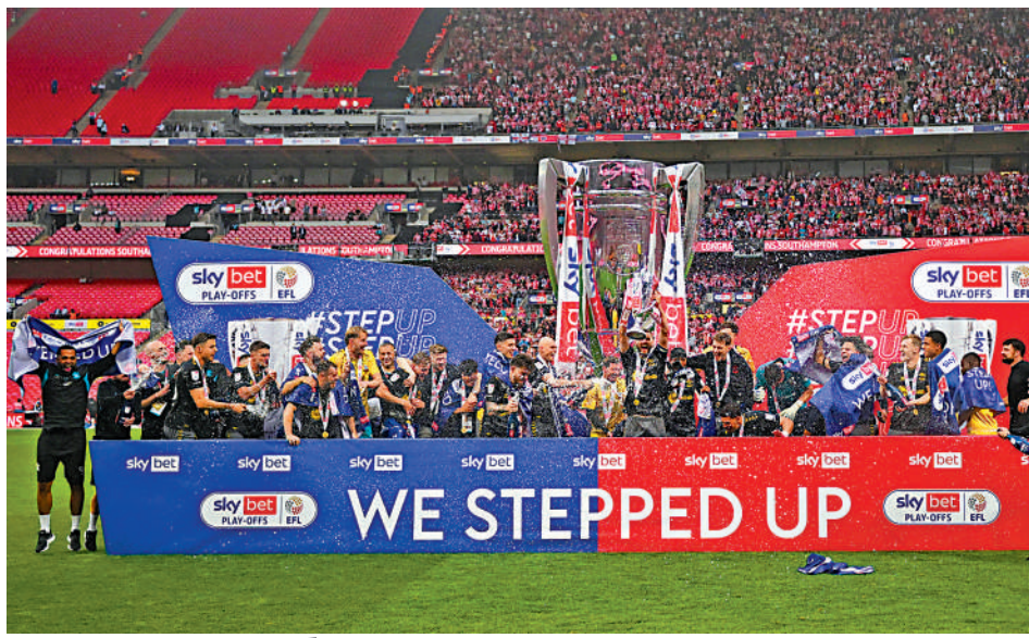
▲修咸頓喜奪升班資格，據報新賽季收益可達一億八千萬英鎊。

平。也許要對英冠球隊公平一點，又或者增加英超賽事刺激性的話，升降賽制上或可作一些調整，例如英冠和英超直接「升3降3」，英冠的第4名與英超尾4球隊踢附加賽，又或者維持現有英冠附加賽，但決賽落敗者仍有機會與英超尾4踢附加賽等，畢竟有機會增加英超球隊流動性，亦為球迷帶來新鮮感。 大公報記者譚德龍