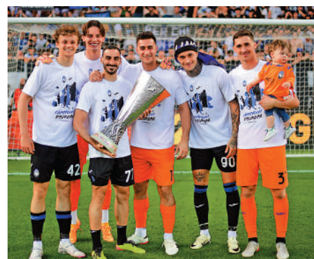
▲阿特蘭大球員賽後展示歐霸盃揚威。

軍。前5名的國際米蘭、AC米蘭、祖雲達斯、阿特蘭大及博洛尼亞出線來季歐聯，羅馬和拉素出線歐霸盃，第8名的費倫天拿已穩奪歐協聯資格，若今屆捧盃而轉戰歐霸盃的話，第9名的拖連奴將補上。