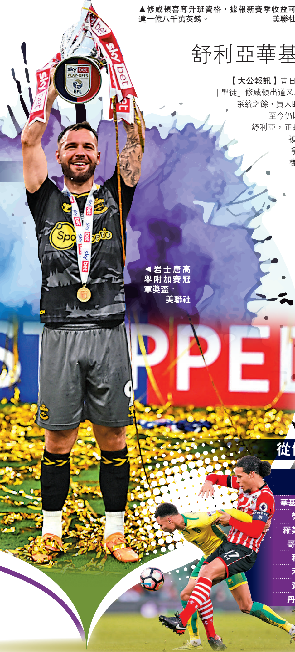
▲岩士唐高舉附加賽冠軍獎盃。