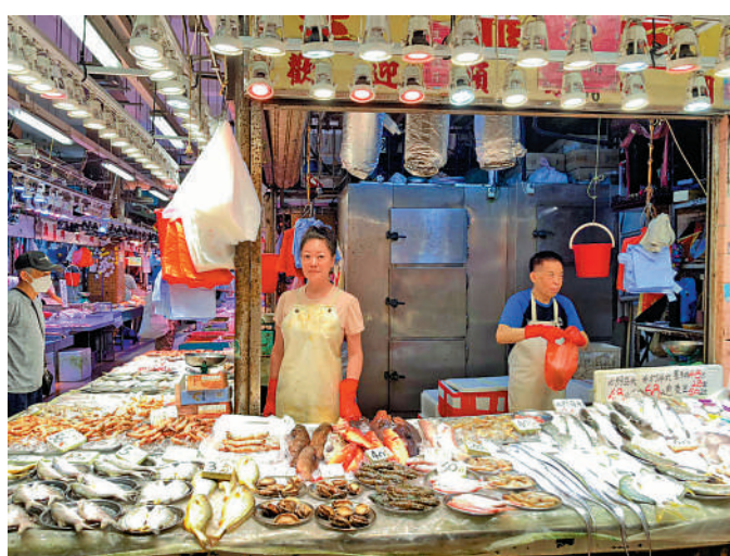
▲牛頭角街市商會副主席翁太表示，商戶希望牛頭角街市翻新後的舖租和冷氣等費用，加幅不要太大，否則成本只能轉嫁到消費者。