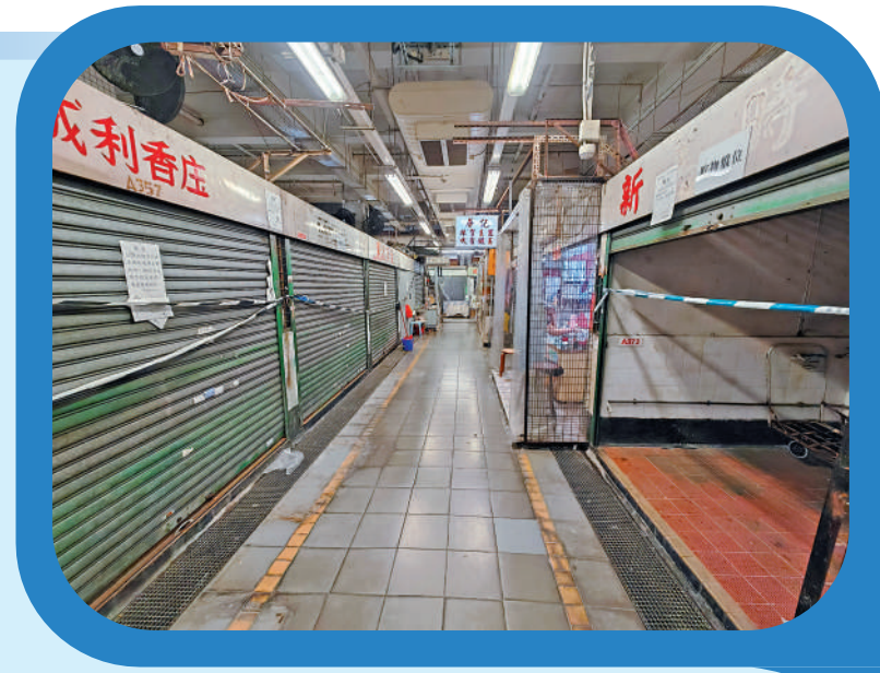
▲牛頭角街市空置檔位由2019年的15%升至去年底的20%。