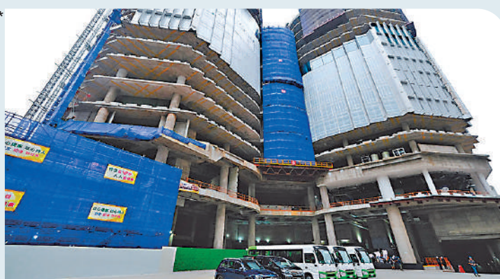
▲瑞銀租用高鐵西九站項目最靠近海濱的全座大樓(右)，共46萬方呎，2026年遷入，租期長達10年。