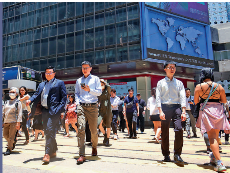
▲特區政府目標在明年底前推動不少於200間家辦在港設立或擴展業務。