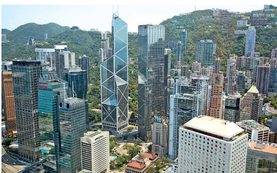
◀低稅率及簡單稅制是在港設立家族辦公室的優點之一。