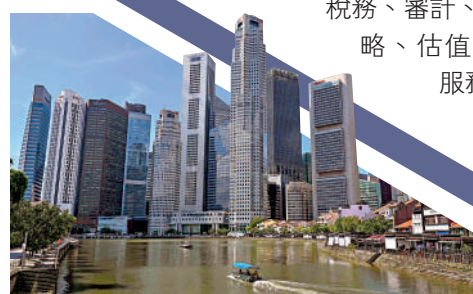
▶香港更能吸引內地富豪家辦落戶。

陳恆澤補充指，申請人對於專業服務的需求非常多元化，可以向專業機構尋求幫助，以安永為例，能提供包括稅務、審計、交易與戰略、估值等方面的服務。