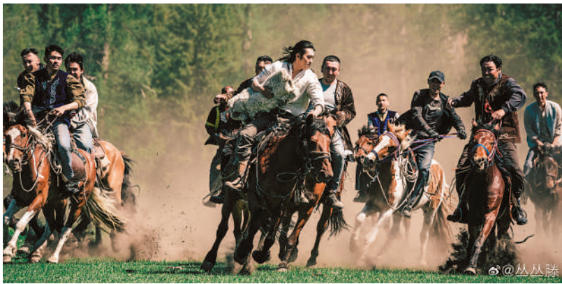
▲劇中男主角巴太策馬揚鞭參加「刁羊比賽」。