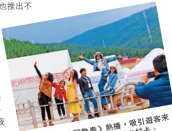
▲隨着《我的阿勒泰》熱播，吸引遊客來到布爾津縣喀納斯景區觀光打卡。

「來哈巴河縣旅遊的人與日增多，目前酒店訂單已預定到6月。」據阿勒泰哈巴河縣厚德大酒店相關負責人介紹，為了讓遊客玩得好、吃得好，酒店提供特色美食、美景、民俗文化活動推薦以及車輛接送等服務。此外，阿勒泰適時推出逛夜