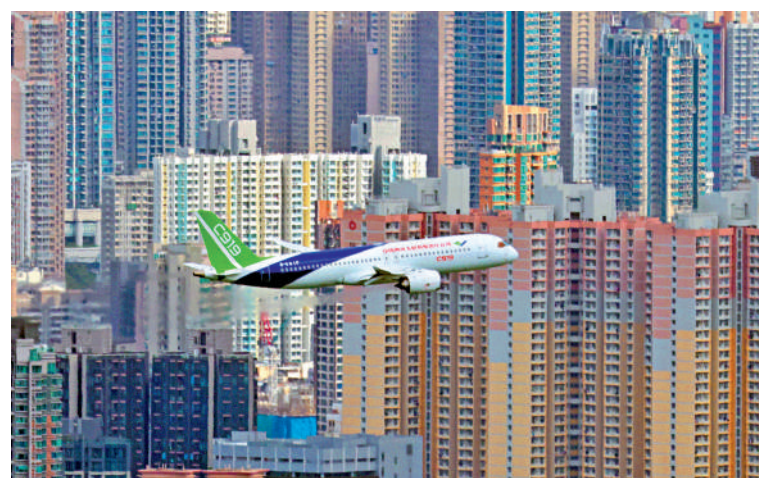
▲2023年12月16日，C919國產大型客機於維港作飛行演示。

以來，越來越多的旅客乘坐、體驗了國產大飛機。在東航C919飛行部的榮譽櫥窗，記者看到，裏面擺放着飛行部獲得的各種榮譽。在一張明信片上，一位來自澳門的乘客寫下了這樣的一段文字：國產大飛機從筆路藍縷到規模初具，您是參與者，我是見證者，讓我們共同祝願國產大飛機越來越好，C919終將飛遍共和國的每一寸山河。