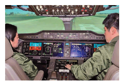
▲C919模擬機駕駛艙還原真機場景。

通過前方的顯示屏（風擋玻璃）可以看到，飛機漸漸騰空起飛，而記者也不由得發出一聲驚呼，「哇，天啊，這好像就輕鬆一躍……」隨後，記者又根據指導收起了起落架，正式開啟了「空中」的翱翔。