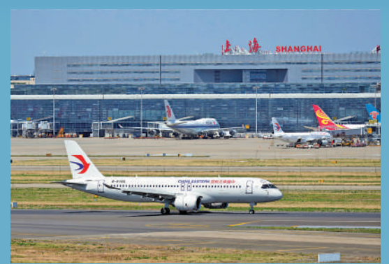
▲5月28日，東航第六架C919大型客機從上海浦東國際機場飛抵上海虹橋國際機場，正式入列東航機隊。