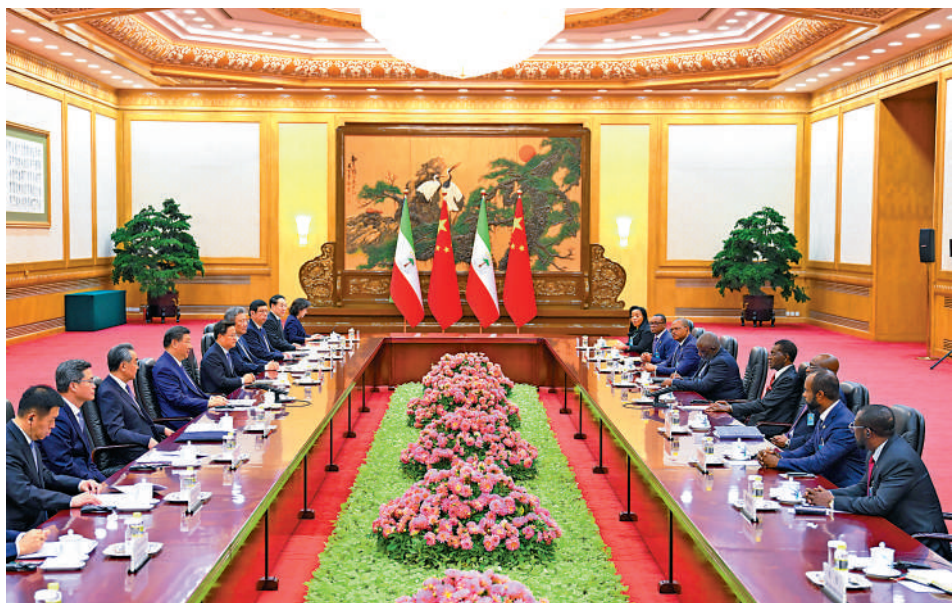
▲5月28日下午，國家主席習近平在北京人民大會堂同來華進行國事訪問的赤道幾內亞總統奧比昂舉行會談。

5月28日下午，國家主席習近平在北京人民大會堂同來華進行國事訪問的赤道幾內亞總統奧比昂舉行會談。兩國元首宣布，將中赤幾關係提升為全面戰略合作夥伴關係。習近平指出，中方願同非方開好新一屆中非合作論壇峰會，進一步弘揚傳統友好，深化團結協作，共商未來發展合作大計，開啟構建中非命運共同體的新篇章。