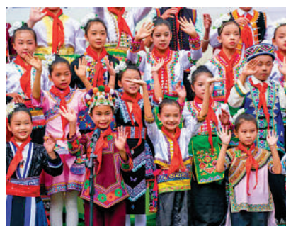
▲5月27日，中國—赤道幾內亞友誼小學的學生通過視頻連線和赤道幾內亞總統奧比昂打招呼。

2015年4月，奧比昂總統訪華期間，代表本國政府宣布一筆捐贈，用於雲南省金平縣第一小學的改擴建。一年多後，一棟5層20個教室、10個衛生間、5間辦公室，總面積約2530平方米的新教學樓落成並投入使用。大山深處的孩子們，有了更好的學習條件。為了表達對兩國深情厚誼的感念，這所小學也有了新名字——中國—赤道幾內亞友誼小學。9年來，已經有2000多個孩子從這裏畢業。